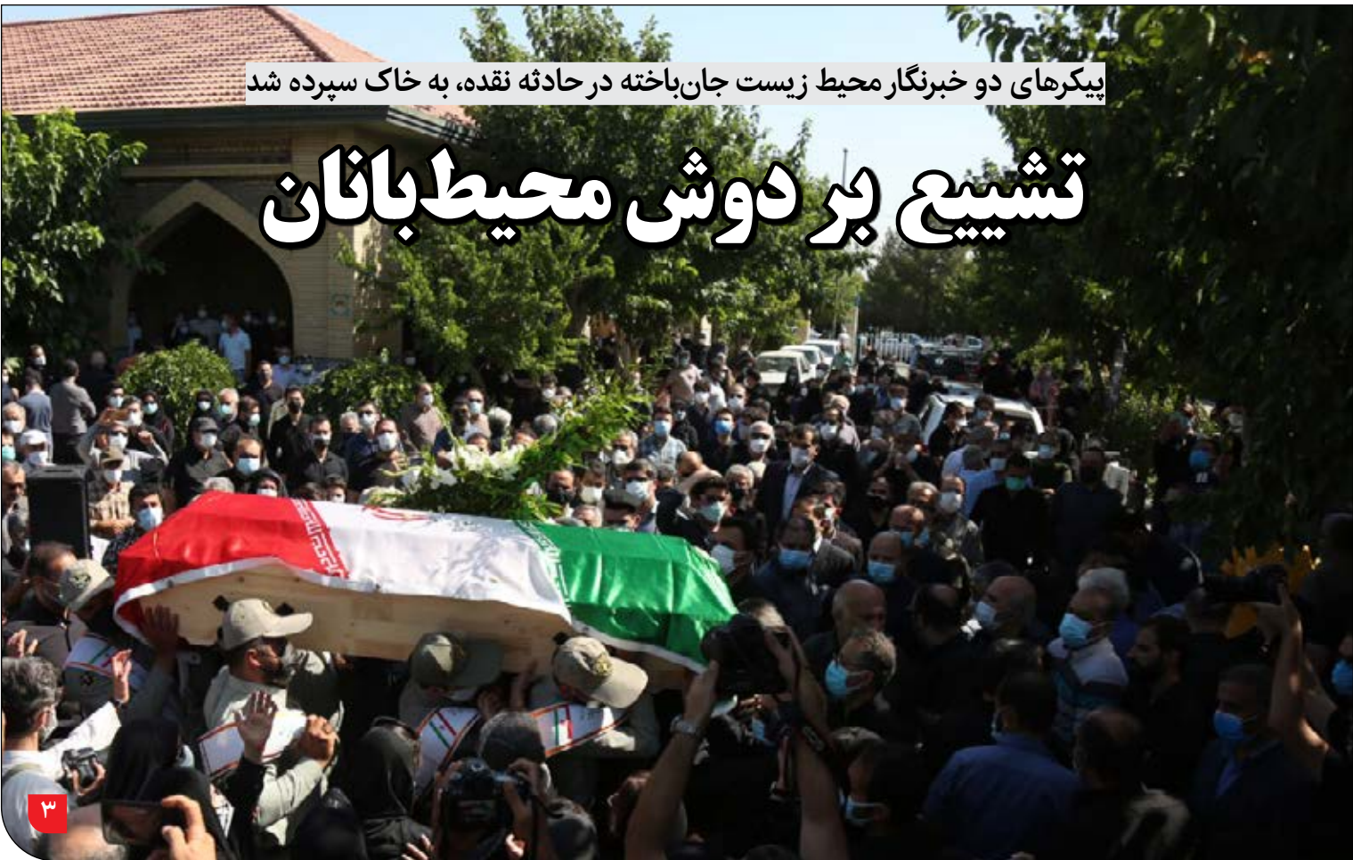
بیکرهای دو خبرنگار محیط زیست جان‌باخته در حادثه نرده، به خاک سپرده شد

مدیرکل محیط زیست استان گلستان: این کارخانه محصول استراتژیک تولید می‌کند و امکان تعطیلی آن وجود ندارد