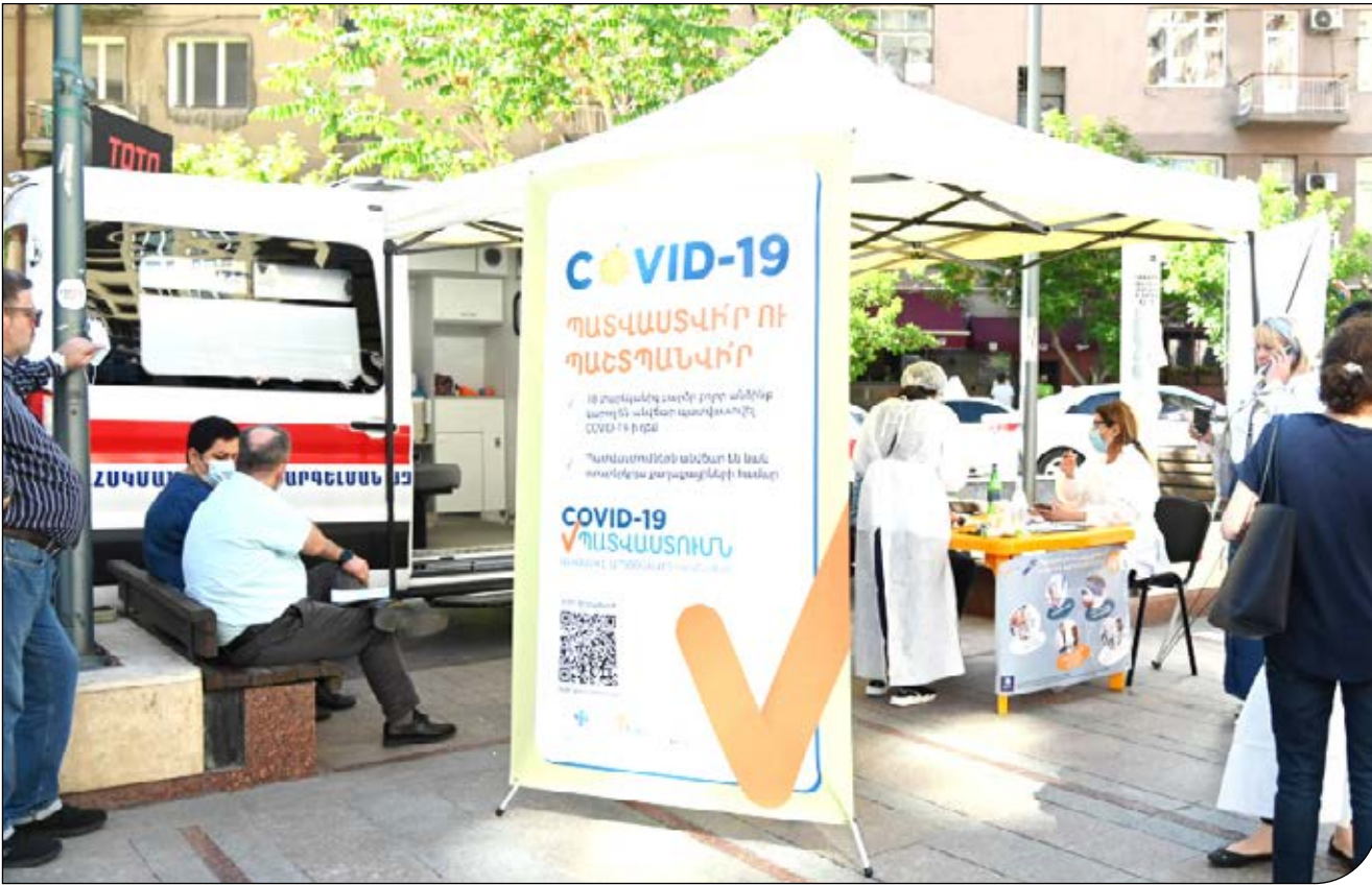
ارمنستان - amnews.am

رآمد «گردشگری واکسن» برای کشورها بسیار بیشتر از عددی است که برای خرید واکسن و ارائه خدمات پرداخت می‌کنند