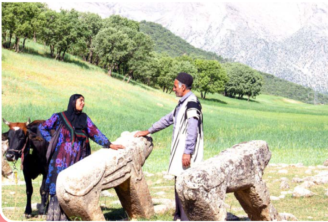
بردشیر نماد ایل بختیاری