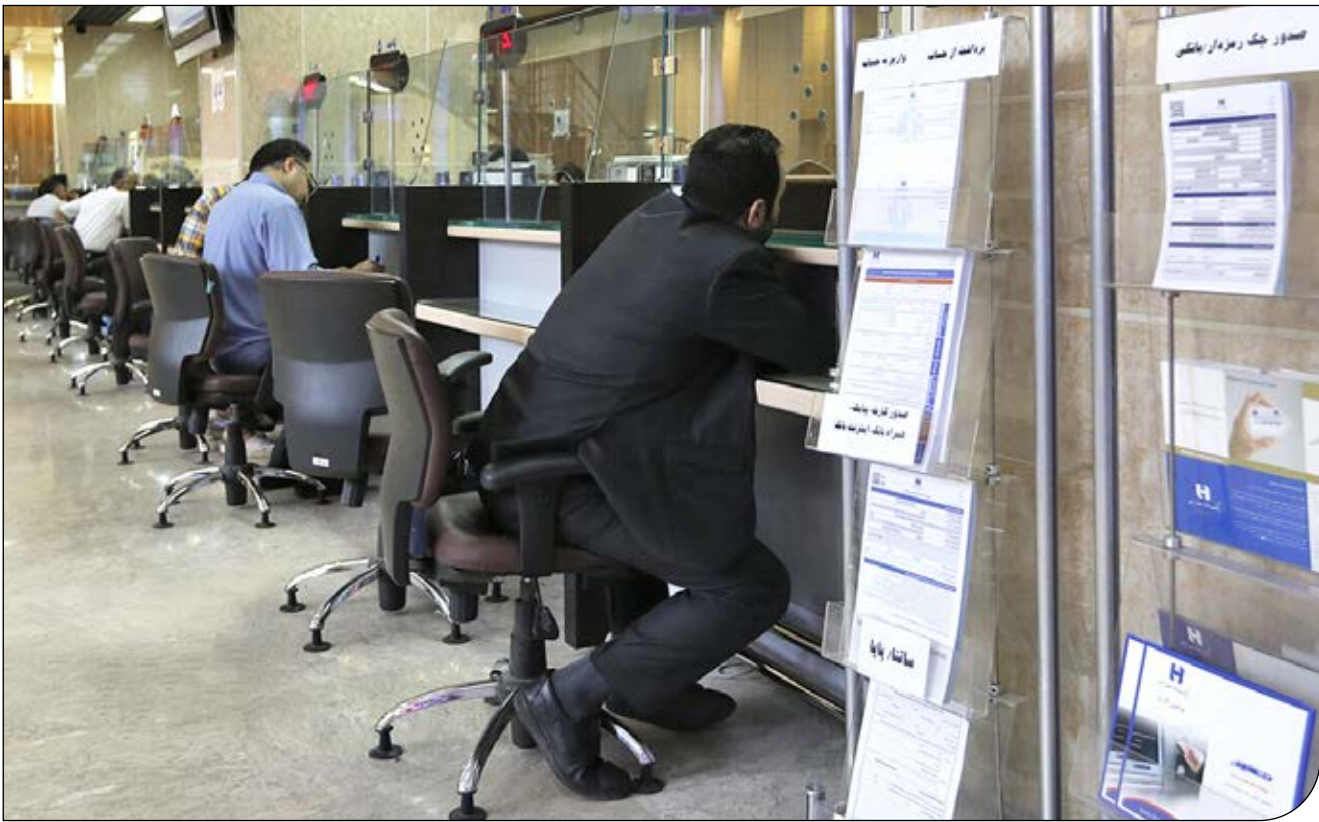
صحنه‌ای از شعبه بانک

دریافت‌کنندگان تسهیلات کرونایی در بخش گردشگری می‌گویند بانک‌ها به ازای هر ماه امهال وام، از ما جریمه دریافت می‌کنند