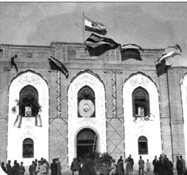
سردر بلدیة تهران که تکمیل شده است

جامعه ما پس از تجربه سه مدل انجمن بلدی، انجمن شهر و شورای اسلامی شهر اکنون صاحب این فراست شده است که درباره مساله کارآمدی شوراها به چارهجویی بپردازد زیرا ناکارآمدی این نهادها در نهایت حاصلی جز دلسردی مردم از زندگی مدنی ندارد و در بهترین حالت شوراها به نردبانهای قدرت برای جاه طلبان تازه کار و خوابگاههای اداری برای بازنشستگان سیاسی می شوند.