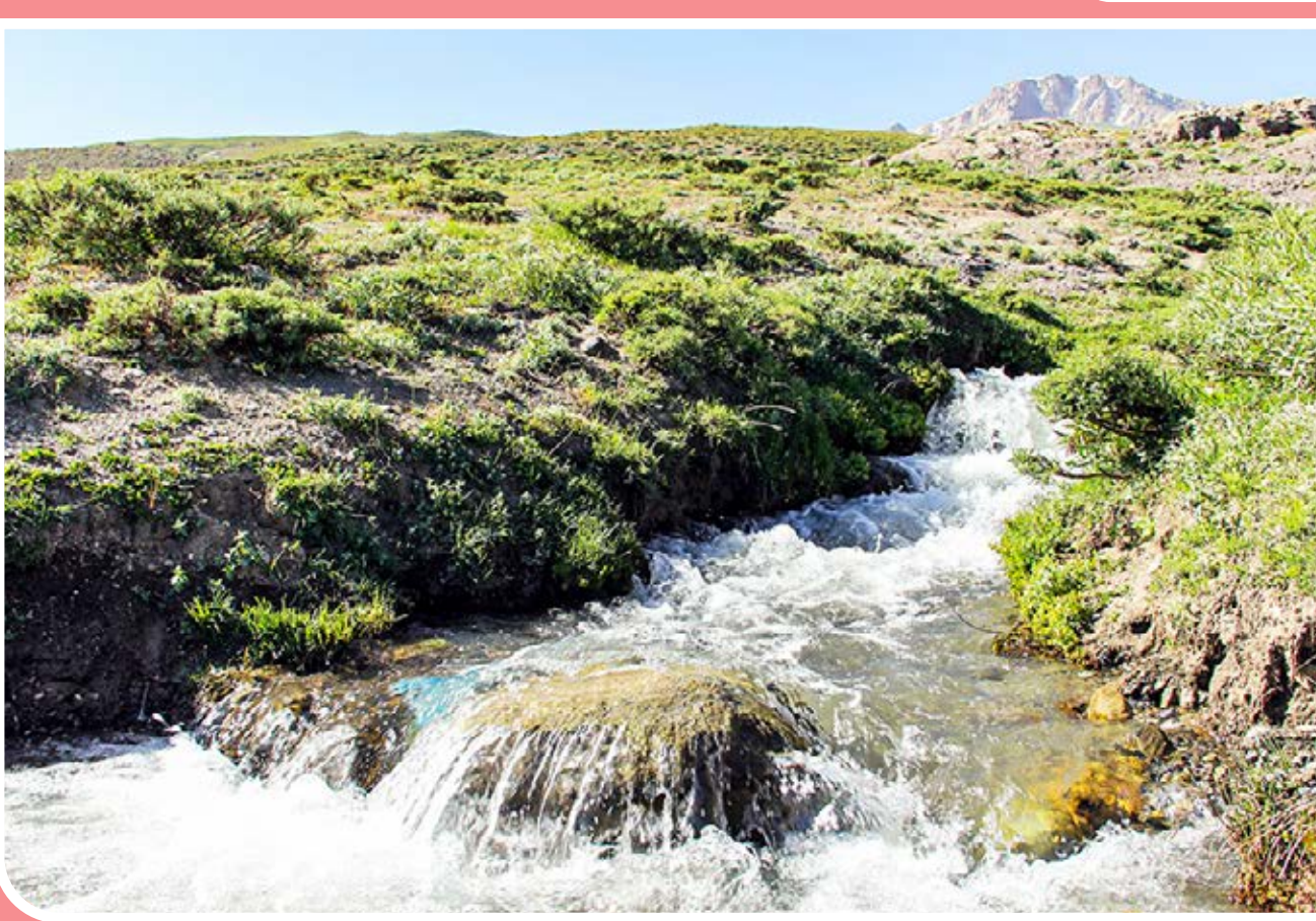
چشم‌انداز کوه بوزنسینا ارومیه