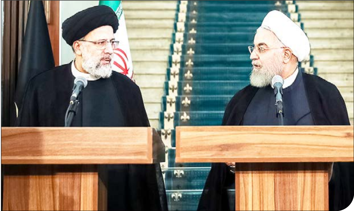
— تسنیم —

علی لاریجانی بیانیه‌ای را در مورد انتخابات ریاست جمهوری روز ۲۸ خرداد منتشر کرد. متن کامل بیانیه دعوت علی لاریجانی از مردم برای مشارکت در انتخابات ۲۸ خرداد ۱۴۰۰ به شرح زیر است.بهر آن است که در اقدام ملی انتخابات، یکسره با خدا معامله کنیم،گرچه برخی رفتارهای نادرست داخلی و خارجی، مزاحمت‌هایی برای حرکت ملت ایجاد کرده؛ اما اراده شما بسیار قوی‌تر از آن‌هاست. امید است با مطالبات حق طلبانه عموم مردم شریف و قانون مدار و عزم مسولین مربوطه روح الهی ناصحیحی که به اعتماد عمومی ضربه می‌زند اصلاح گردد.ملت عزیز. در مشکلات سخت تحریم، صبوری کردید؛ ان‌شالله ظفر در پیش است.روز ۲۸ خرداد ۱۴۰۰ را روز ملی سرنوشت بدل کنیم.»