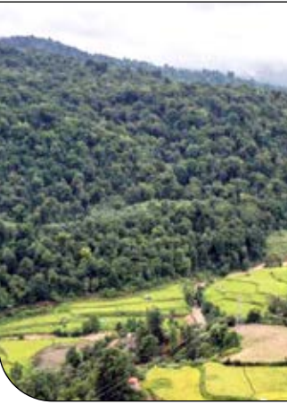
جنگل های هیرکانی

داس مه همچنین می گوید: «به دنبال انجام این موارد، تبادل نظر شد و موضوع را با بخش حقوقی سازمان جنگل ها در میان گذاشتیم و معاونت حقوقی ریاست جمهوری هم پای کار آمده بودند و همه اینها دخیل بودند تا پرونده به سرانجام برسد. تک تک آنها نقش داشتند و این یک ائتلاف جمعی بود که نتیجه خوبی داد.»