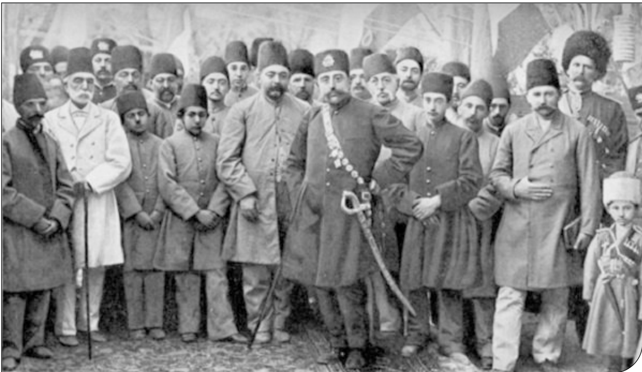
مردان و زنان قاجاری با لباس‌های ساده در کوچه و خیابان‌های گیلان قرن نوزدهم به تصویر کشیده شده‌اند. بازارهایشان، خانه‌هایشان، مزارع و جنگل‌هایشان. همه را دیمیتری ارماکوف، عکاس گرجی به تصویر کشیده و حالا ۲۵۰ عکس او از گیلان که در موزه ملی گرجستان نگهداری می‌شد در کتاب «گیلان عصر قاجار در عکس‌های دیمیتری ارماکوف» منتشر شده است. کتاب به تازگی منتشر شده و در آخرین نشست شب‌های بخارا از آن رونمایی شد. در این رونمایی پژوهشگران ایرانی و گرجی صحبت کردند و هریک از اهمیت ارماکوف گفتند؛ کسی که نه تنها برای گرجی‌ها بلکه با عکس‌های مستندش از ایران، برای ایرانی‌ها هم اهمیت فراوانی دارد. چنان که لیلیا ماتاساویلی، از مورخان گرجی در این جلسه گفت: «ارماکوف در اواخر قرن ۱۹ نه تنها در گرجستان بلکه در قفقاز روسیه و فرانسه مشهور بوده و در طول فعالیت‌های پربراش ۳۶ نشان و جایزه مختلف کسب کرده است. او هم عضو انجمن باستان‌شناسان و هم عضو اتحادیه هنرهای زیبای روسیه بود و علاوه بر عکاسی، مجموعه‌دار بزرگی هم بوده است و عکس‌های باارزش را گردآوری می‌کرد تا تصویر عمر خود باشد. خدمت او نه فقط به گرجستان که به کل منطقه است چرا که میراث او نه تنها شامل عکس‌های تاریخی است بلکه زمینه خوبی را برای انجام مطالعات علمی و هنری است.»

ناصر فکوهی، انسان‌شناس: ارماکوف از مهمترین عکاسان نسل اول جهان است که برای ثبت واقعیت اجتماعی سرخ عکاسی رفت، جزئیات عکس‌های او برای فرهنگ‌شناسی اهمیت فراوانی دارد