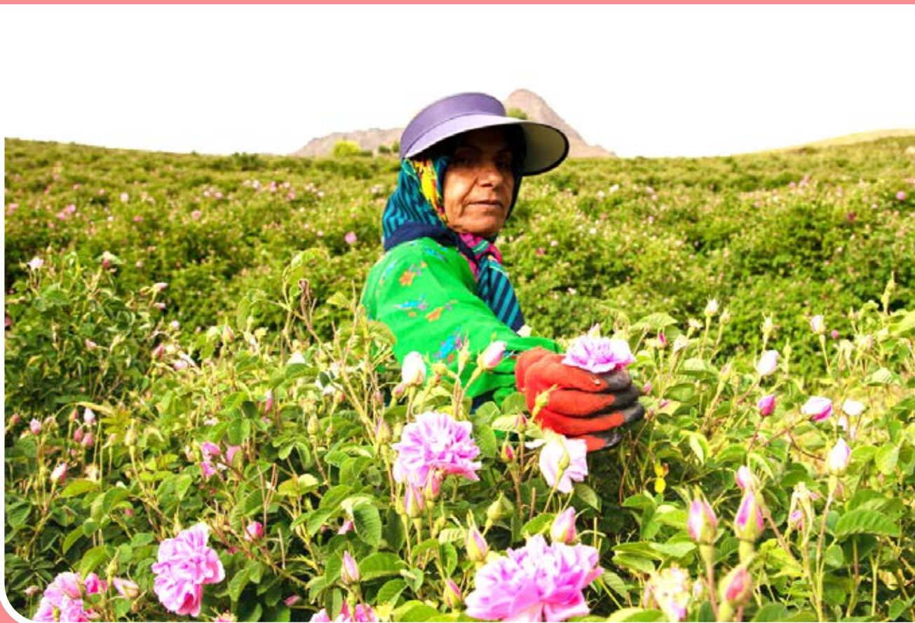
بهار گل‌های محمدی در چهارمحال وبختیاری