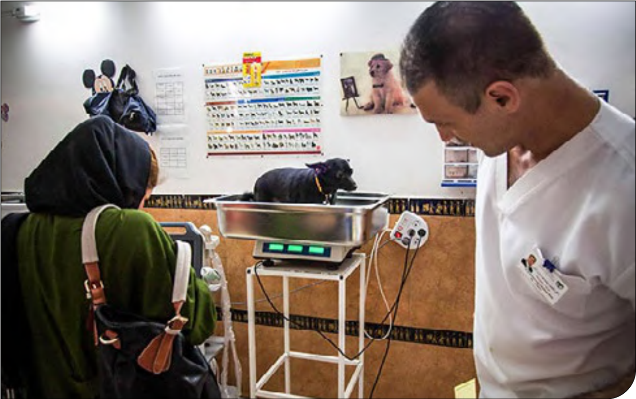
— تهران — [۱۵]

سال شانزدهم | شماره پیاپی ۲۰۱۱ | دوشنبه ۲۷ اردیبهشت ۱۴۰۰