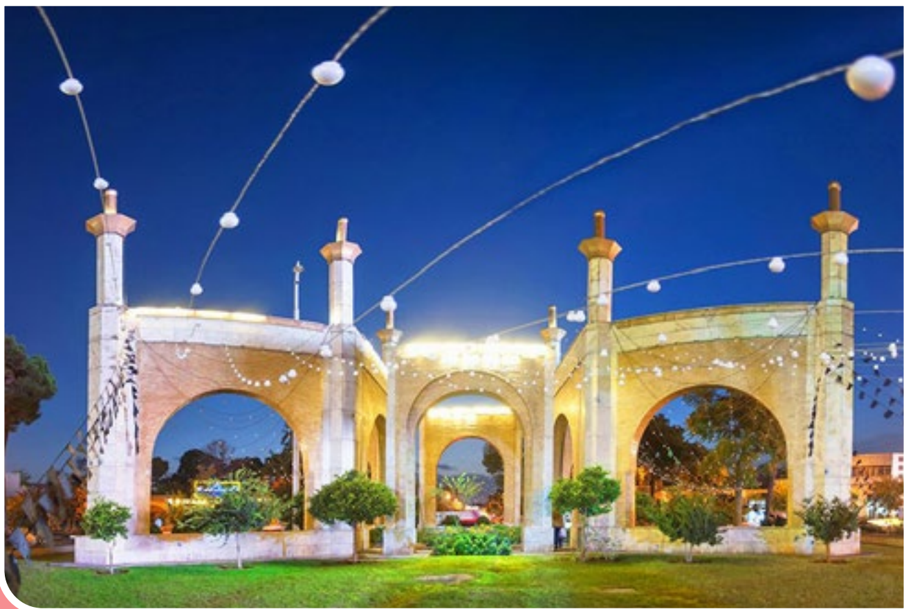
دروازه‌های تهران؛ میدان قزوین