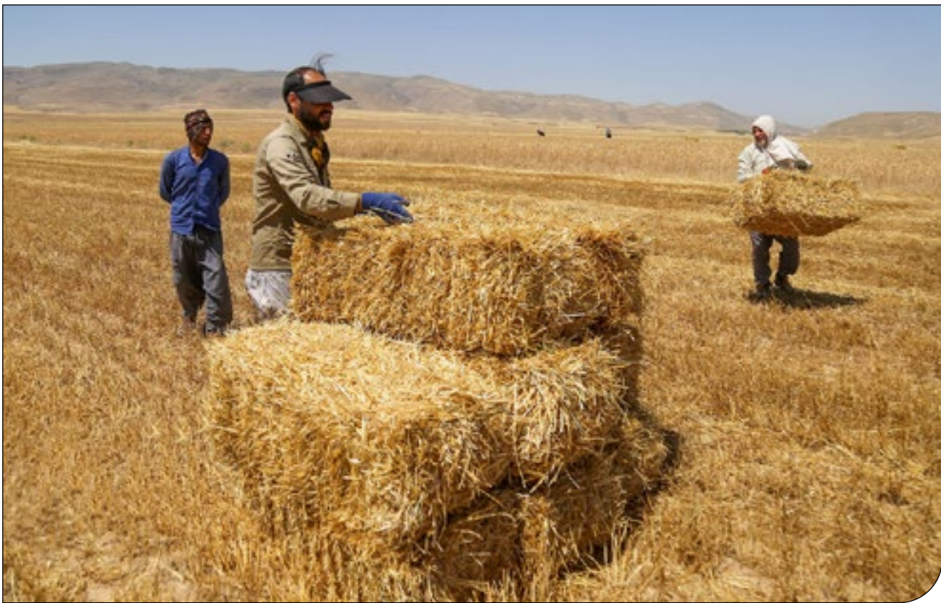
- ۳ -

احیا کننده گندم خراسان: به خاطر رانتی که وجود دارد سبوس و جنین گندم در کارخانه آرد، جدا می‌شود