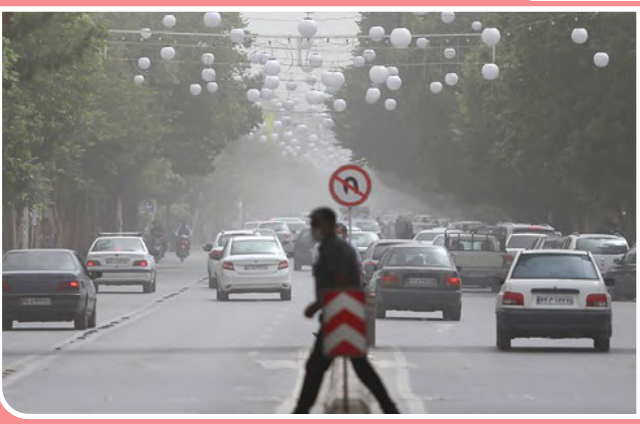
کرمان در گردوغبار