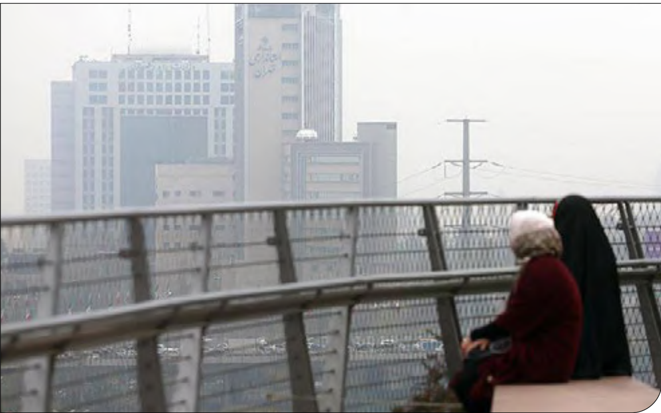
— ۱۰۰ —

مدیر واحد پایش کنترل کیفیت هوای تهران، علت کاهش کیفیت هوا را در این ماه، کاهش بارندگی و ایجاد کانون‌های گردوغبار در اثر خشکسالی برشمرده بود