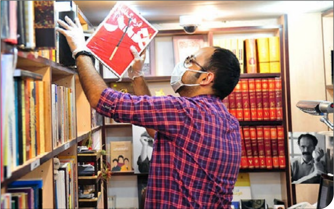
| مشارکت یوز |

جایزه بوکر بین‌المللی که هر ساله به بهترین اثر داستانی ترجمه شده به انگلیسی اهدا می‌شود، امسال از بین آثاری از چهار قاره و در ۱۱ زبان مختلف، ۶ نامزد نهایی معرفی کرد.به گزارش ایرنا از پایگاه اطلاع‌رسانی لیبرالی هاب، جنگ فقرا (The War of the Poor) از اریک ویلر به زبان فرانسوی، به یاد خاطره (In Memory of Memory) اثر ماریا اسپیناوا به زبان روسی، مضرات سیگار کشیدن در تخت‌خواب (The Dangers of Smoking in Bed) اثر ماریانا اتریک به زبان اسپانیایی، در شب همه خون‌ها سیاه است (At Night All Blood Is Black) اثر دیوید دیوپ به زبان فرانسه، وقتی دست از درک دنیا برمی‌داریم (When We Cease to Understand the World) اثر بنیامین لاباتوت به زبان اسپانیایی و کارمندان (The Employees) نوشته الگا راون به زبان دانمارکی، ۶ اثری هستند که به رقابت نهایی برای دریافت این جایزه راه یافتند.برنده این جایزه دوم ژوئن (۱۲ خرداد) در یک مراسم مجازی معرفی می‌شود و جایزه ۵۰ هزار پوندی بین نویسنده و مترجم تقسیم می‌شود.