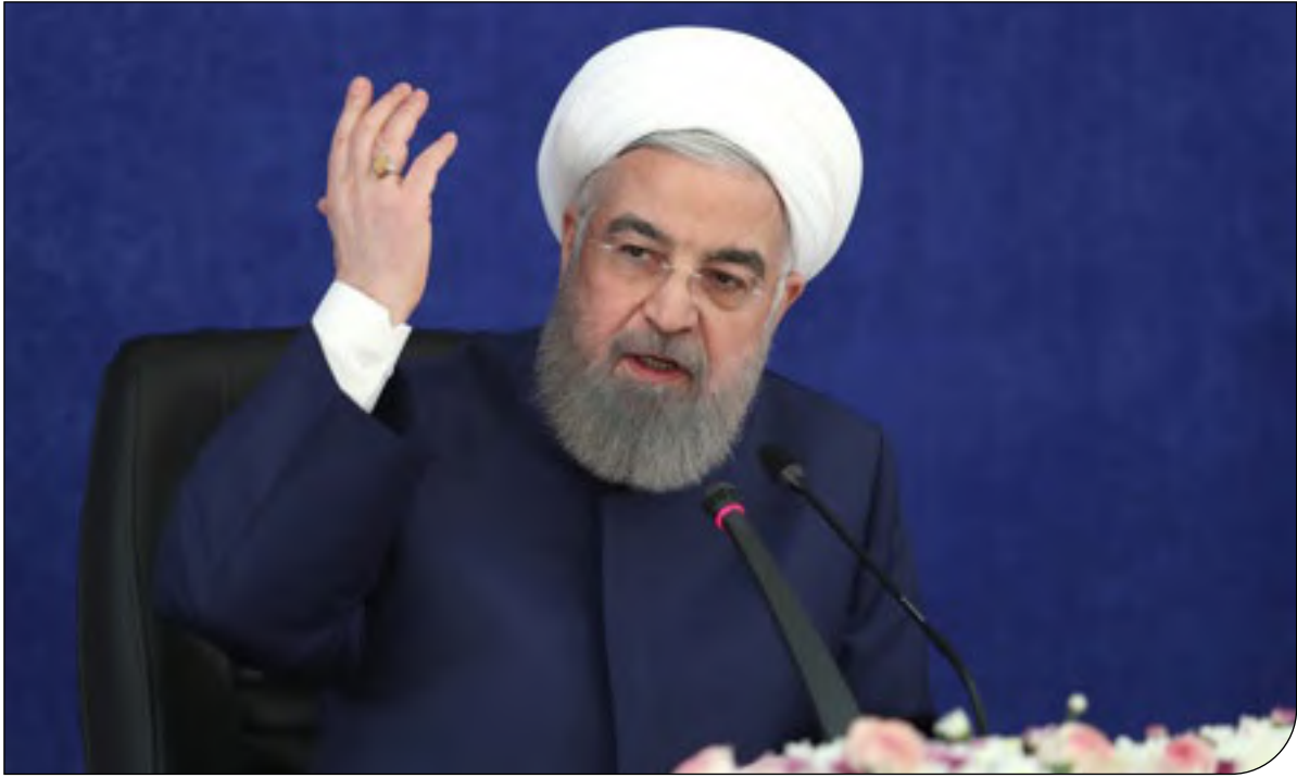
| President.ir |

به معنای واقعی خودش یا نگرفته است سخنگوی شورای نگهبان در بخش دیگری از سخنان به نقش احزاب در انتخابات اشاره کرد و افزود: یکی از مشکلات در انتخابات ما نقش احزاب است؛ انتخابات در همه دنیا فعالیت‌ی است که پیش‌فرض و مقدمه‌اش احزاب هستند. کدخدایی اظهار داشت: متأسفانه در کشور ما حزب به معنای واقعی خودش یا نگرفته است. او با بیان اینکه احزاب در انتخابات سهمیه ندارند، گفت: در کشور ما ارتباط احزاب با فرد کاندیدا به نحوی است که اگر آن فرد مورد حمایت حزبی، صاحب کرسی و دارای مسئولیتی شود و احیاناً با عهده مسئولیتش به خوبی برنیاید، آن حزب به هیچ‌عنوان پاسخگو نیست؛ لذا احزاب باید در انتخابات سهمیه روشن داشته باشند و پس از انتخابات هم نسبت به عملکرد نمایندگان حزبی خود پاسخگو و مسئولیت‌پذیر باشند. رئیس پژوهشکده شورای نگهبان با بیان اینکه متأسفانه احزاب در کشور ما از بالا به پایین شکل گرفته و شخص محور است، گفت: حزب باید نقش و حضور دائمی داشته و جمع محور باشد؛ حزب باید مانفیتش داشته باشد، باید تربیت‌محور و کادرساز باشد و در تعریف فعالیت حزبی نقش و حضوری مؤثر داشته باشد؛ لذا اگر احزاب به معنای واقعی وجود داشته باشد، افرادی که رای می‌آورند یا توجه به اینکه حزب به عملکرد آن‌ها نظارت می‌کند و آن فرد هم خود را نسبت به اموری که انجام می‌دهد پاسخگو می‌داند، به نحوی عمل می‌کند که از گردونه حزب خارج نشده و بتواند بار دیگر با جلب نظر حزب تداوم مسئولیت خود را داشته باشد.