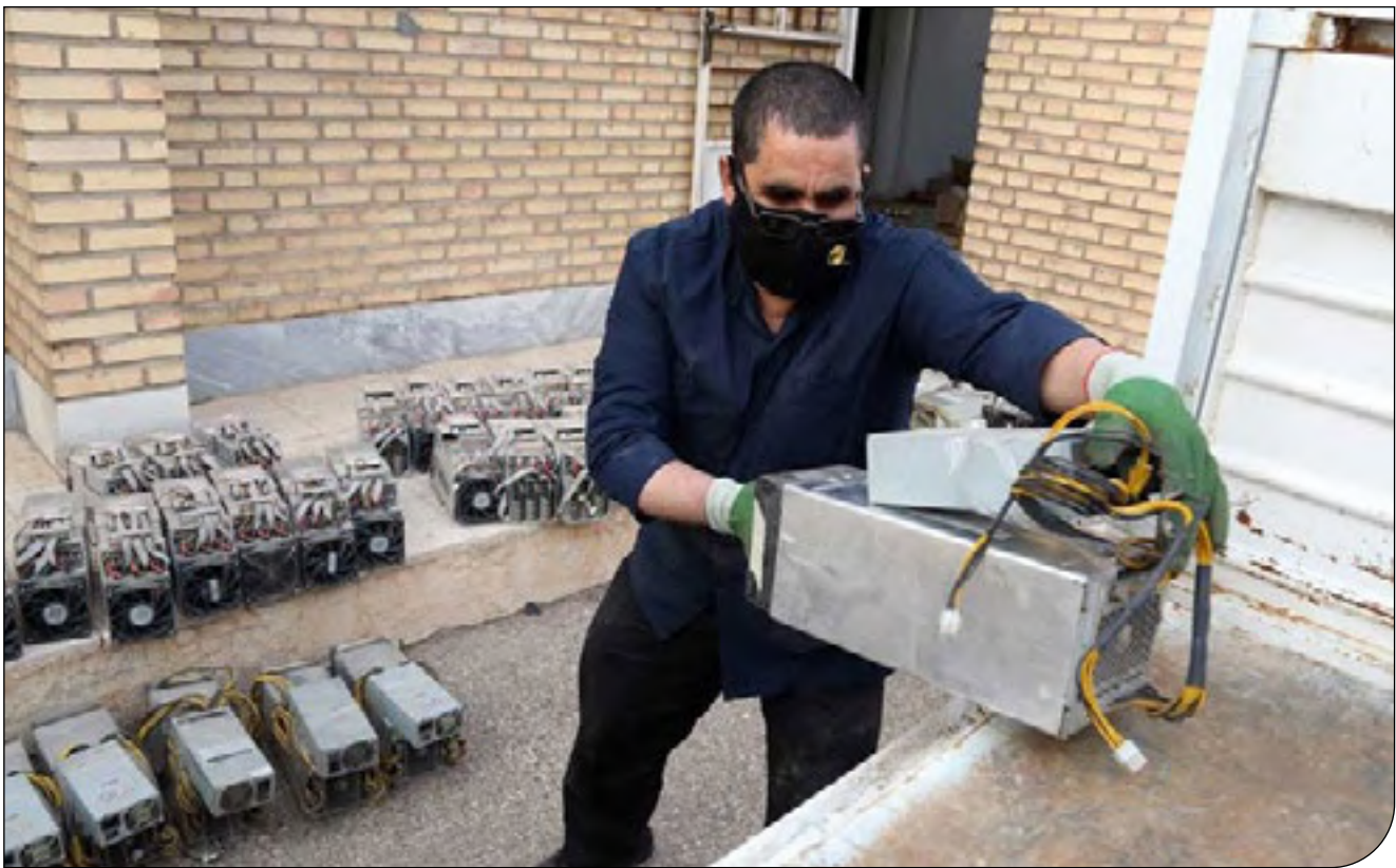
تیمار دارند سرمایه های خرد خود را در صنعت استخراج رمزارزها سرمایه گذاری کنند، امکان استفاده از خدمات هتلینگ و میزبانی توسط مزارع بزرگ را خواهند داشت

مزارع بزرگ استخراج در مناطق اولویت دار می توانند از خرده ماینرها میزبانی کنند