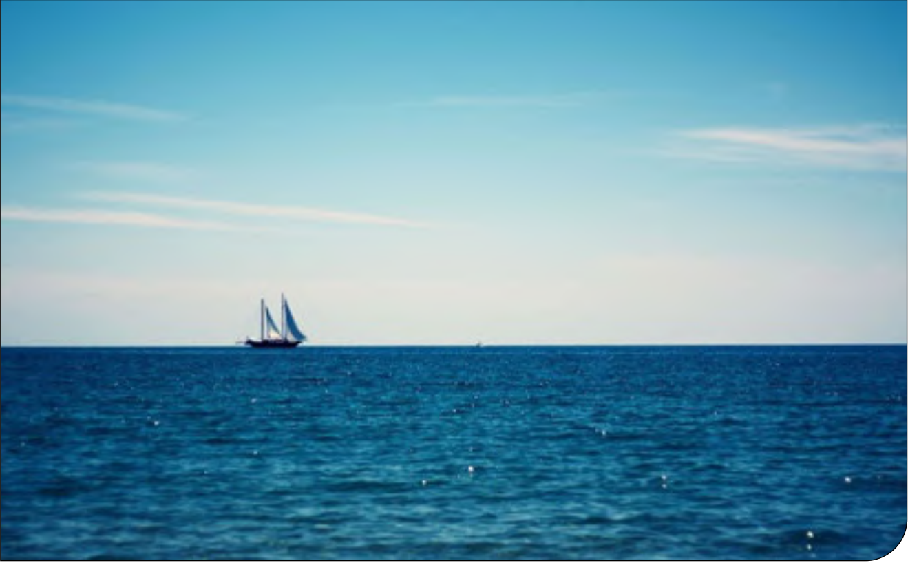
— champ —

با فرکانس کمتر از ۱۰۰ هرتز، هر ده سال افزایش سه دسی‌بلی داشته است