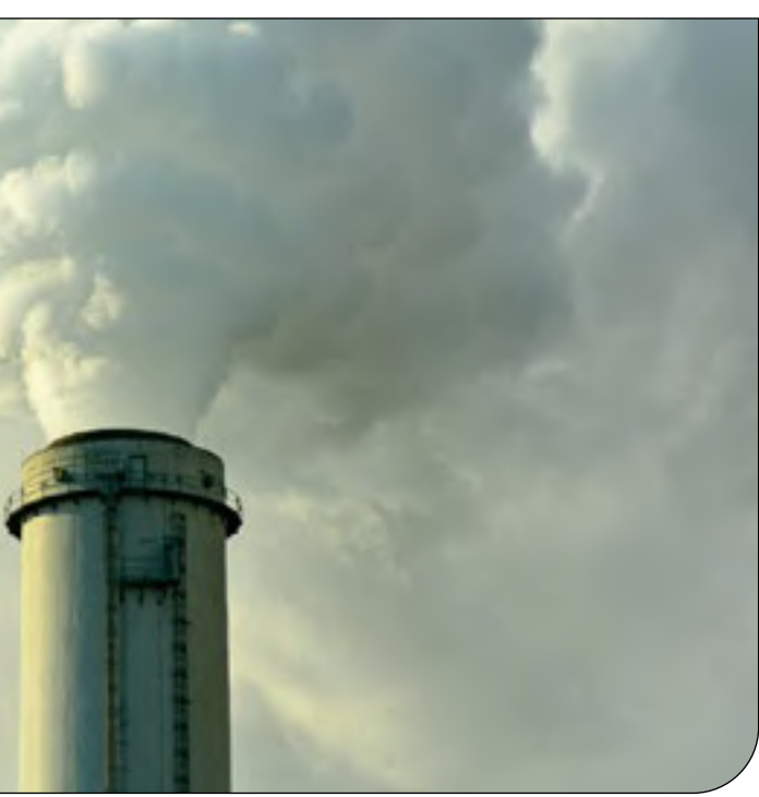
— Alarmy —