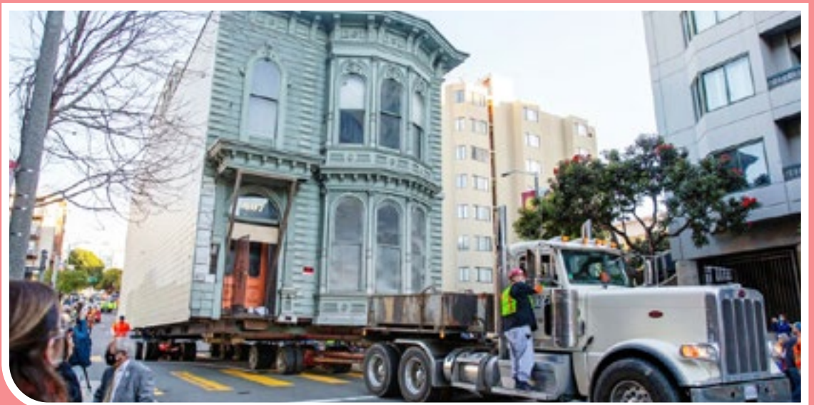
خانه تاریخی ۱۳۹ ساله ویکتوریایی در سانفرانسیسکو به مکان جدید خود در شش بلوک دورتر منتقل شد.