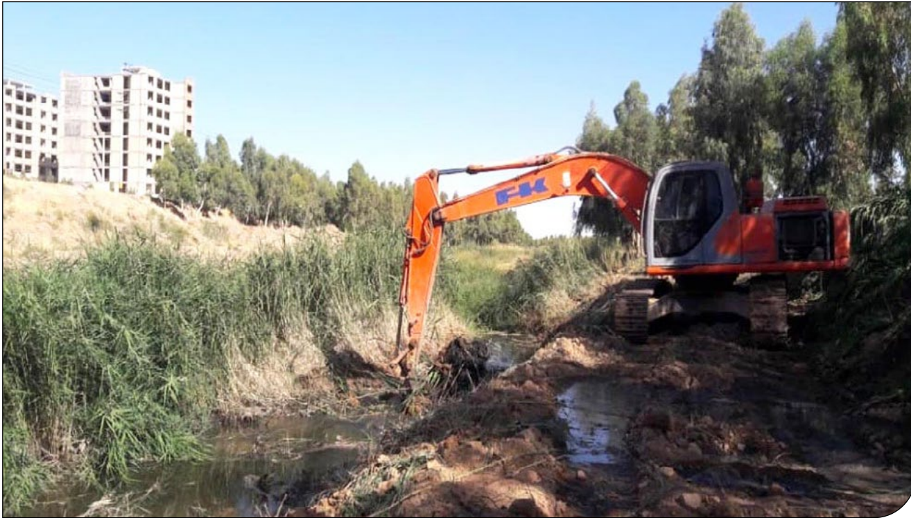
عملیات شهرداری شیراز

فاضلاب برخی کارخانه‌ها و مراکز به این رودخانه‌ها موجب بروز معضلات محیط زیستی برای شیراز شده است