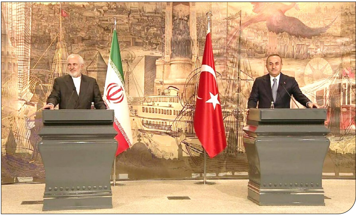
عمین، قفس آتلان | ۱۳۹۹

بر اساس دستورهای اجرایی جو بایدن در راستای مقابله با بحران تغییرات اقلیمی، از این پس قراردادهای جدید برای اجاره زمین‌ها و حوزه‌های آبی فدرال جهت استخراج و توسعه نفت و گاز متوقف می‌شود و در مقابل، تولید برق با نصب توربین‌های بادی در دریاها تا سال ۲۰۳۰، دو برابر می‌شود. همچنین قراردادهای کنونی در این زمینه نیز مورد بازبینی قرار می‌گیرد.