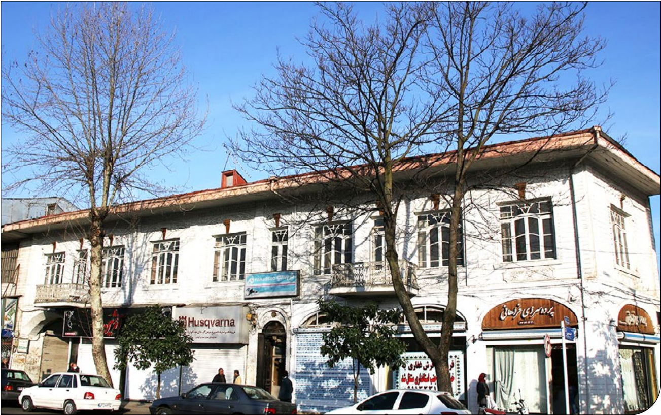
گوشش رایجبر | [۱۶]

بعد از تخریب سرای میخچی، نوبت به هتل فردوسی رشت رسید