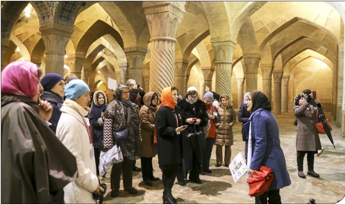
رئیس کانون انجمن‌های صنفی راهنمایان در جریان بازدید از مکانی در تهران.

می‌توان گفت نمایندگان پشت یک قشر آسیب‌پذیر را خالی کردند