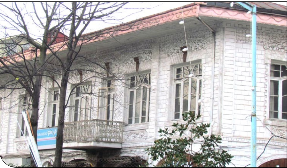
صدای میراث | [۱۶]

او معتقد است که این هایپرمارکت در دل بافت تاریخی شاهرهای می‌شود برای تخریب بیشتر خانه‌های تاریخی منطقه. روندی که کاملا ناقص احیای بافت تاریخی است: «احداث هایپر مارکت، حتی دو طبقه، در جایی که پیاده راه است و خیابان‌هایش وسط بزرگترین بازار کشور قرار گرفته، می‌تواند بازار را تحت تأثیر خود قرار دهد و افراد دیگر را ترغیب کند که در منطقه پاساژ و هایپر مارکت راه بیندازند. تخریب این هتل یک آبروبریزی بزرگ است.»