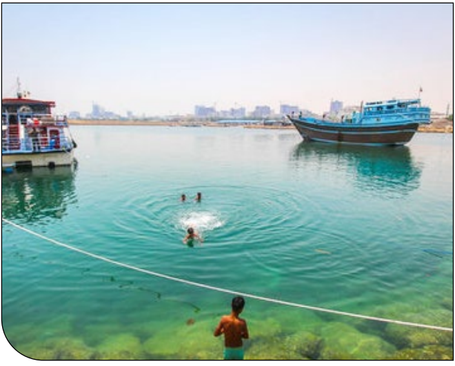
پروژه اسکله نخل ناخدا باید تخریب شود