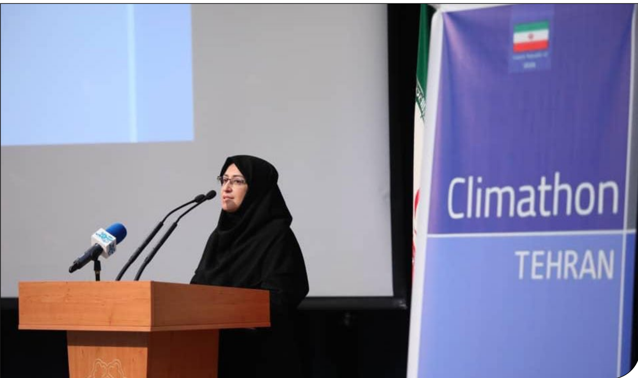
محیط زیست - تهران - گزاره

ایپام (ما گزارش های جهانی می گویند، زمین حدود ۲۸ تریلیون تن یخ بین سال های ۱۹۹۴ تا ۲۰۱۷ از دست داده است و محققان برآورد کرده اند که حدود دو سوم از یخ های ذوب شده به دلیل گرمایش اتمسفر و حدود یک سوم به دلیل گرم شدن دریاها بوده است. آب شدن یخ های قطبی از جمله تبعات گرمایش زمینند که باعث بهم خوردن تعادل سیاره مادر می شود. تحقیقات تازه نشان می دهد که وضعیت گرمایش شهر اسفبار است و بسیاری از کشورهای در حال توسعه جز قریبانیان اصلی این تغییرات اقلیمی اند. رویداد کليماتون همه ساله برای مقابله با گرمایش زمین در ۱۴۵ کلان شهر دنیا برگزار می شود و پژوهشگران محیط زیست شهری ایده های خود برای مقابله با این پدیده را ارائه می دهند. تهران هم سه سالی است که به رویداد کليماتون جهانی پیوسته است و از ایده های سازمان های مردم نهاد استقبال می کند. دیروز در جریان اختتامیه این رویداد از ایده های تازه که برای مقابله با گرمایش زمین که در پایتخت اجرا می شوند، تقدیر شد.