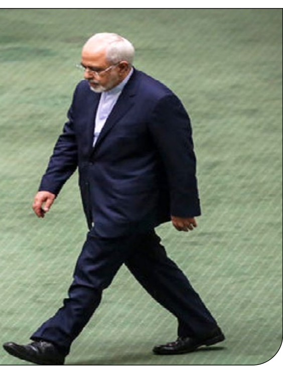
عیسی: باشگاه خبرنگاران

واشنگتن‌پست به نقل از اف‌بی‌آی گزارش داد مقامات فدرال در آمریکا «رابلی جون ویلیامز»، یکی از آشوب‌گران کنگره را که ادعا می‌شود لپ‌تاپی از دفتر ناسی پلوسی، رئیس مجلس نمایندگان آمریکا به سرقت برده، را دستگیر کرده‌اند. به گزارش ایسنا به نقل از اسپوتنیک، شریک سابق ویلیامز به اف‌بی‌آی گفته است که ویلیامز جین آشوب ۶۰تویه در ساختمان کنگره آمریکا، لپ‌تاپ یا هارددیسک را به سرقت برده است. مقامات اکنون در حال تحقیق درباره این ادعاها هستند. واشنگتن پست افزود طبق گزارش‌ها، دوستان این زن دارای ویدیوهای هستند که در آن ویلیامز دیده می‌شود که قطعه الکترونیکی مذکور را از دفتر پلوسی می‌دزد. شریک سابق ویلیامز، این‌طور که در شکایت جنایی آمده، همچنین به اف‌بی‌آی گفت ویلیامز قصد داشته این قطعه کامپیوتری را به دوستی در روسیه بفرستد که او هم قصد داشته آن را به سرویس اطلاعات خارجی روسیه بفروشد.