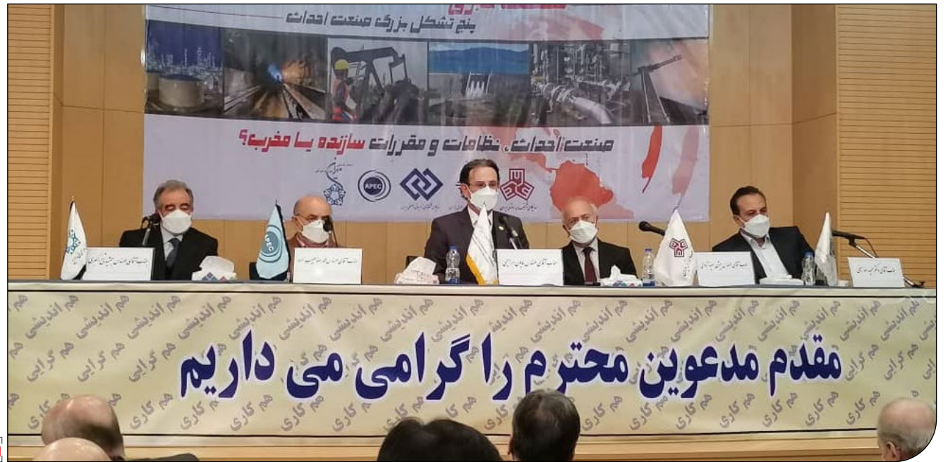
نایب رئیس هیئت مدیره کانون سراسری شرکت‌های پیمانکاری در جریان نشست خبری

نایب رئیس هیئت مدیره کانون سراسری شرکت‌های پیمانکاری: ما در حالی که در عراق و سوریه با داعش جنگیدیم و خون دادیم اما نتوانستیم هیچ امتیازی در بخش پروژه‌های این شرکت‌ها بگیریم