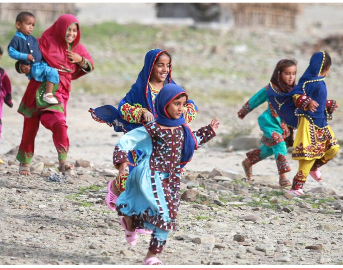
ایسنا | منطقه «دشتیاری» بلوچستان یکی از محروم‌ترین مناطق ایران محسوب می‌شود.