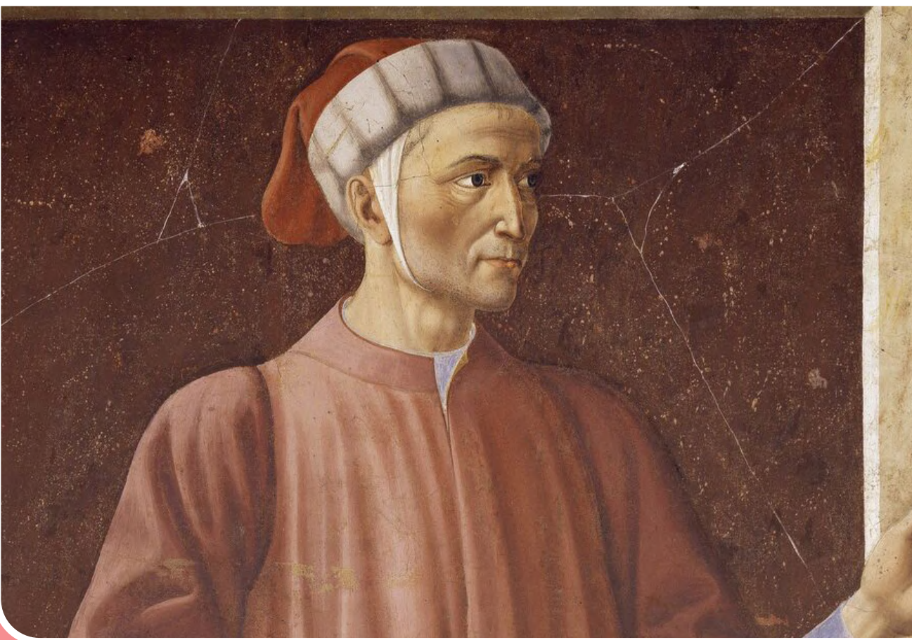
ایرنا | گرمیادداشت هفتصدمین سالمرگ «دانته» با یک نمایشگاه مجازی