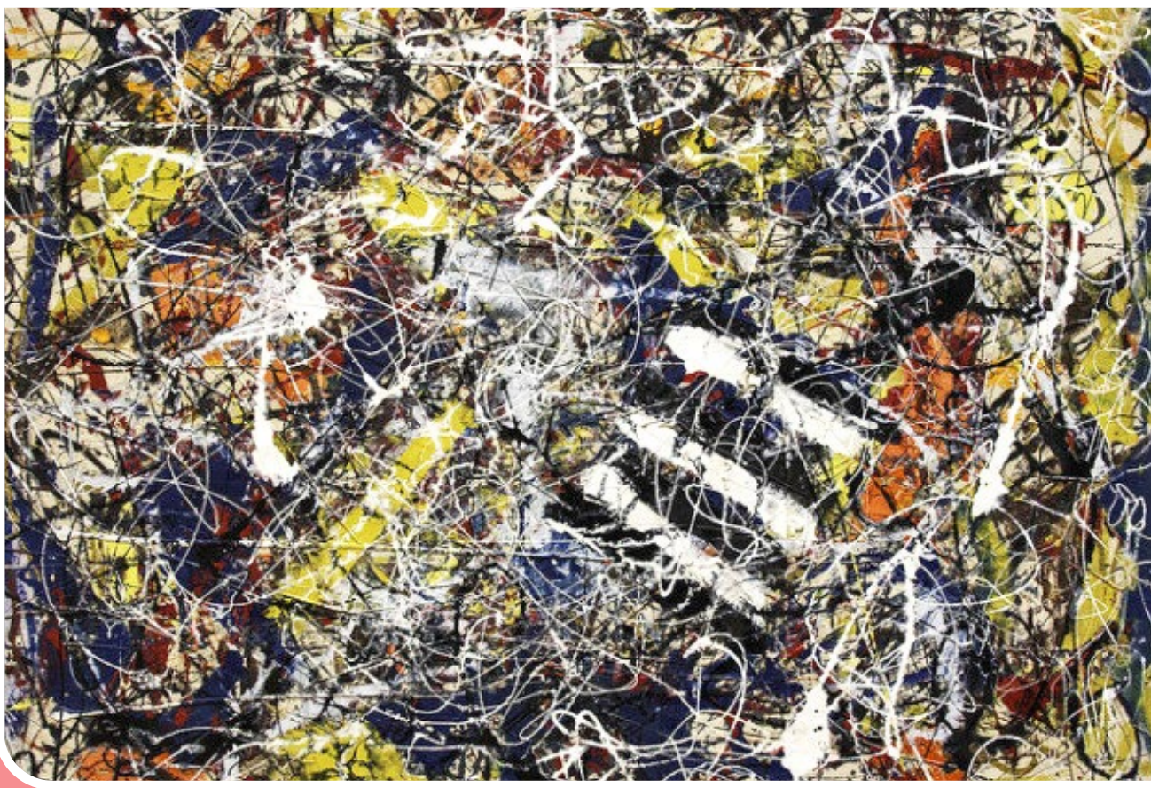
ایسنا | «جکسون پولاک» هنرمند آمریکایی یکی از گرانترین نقاشان تاریخ است. او به عنوان چهره جنبش اکسپرسیونیسم انتزاعی شناخته می‌شود؛ هنرمندی که بر روی تابلوهای نقاشی‌اش قدم می‌گذاشت و شیبفته آن‌ها بود