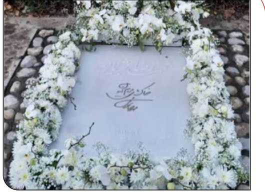
سنگ مزار استاد محمدرضا شجریان پس از گذشت نزدیک ۸۵ روز از درگذشت ایشان، در جای خود نصب شد. در این سنگ علاوه بر نام «محمدرضا شجریان»، عبارت «حاکم پای مردم ایران» با دست‌خط و امضا استاد شجریان حک شده است.