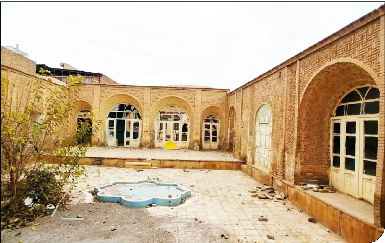
— اید ابراهیمی —