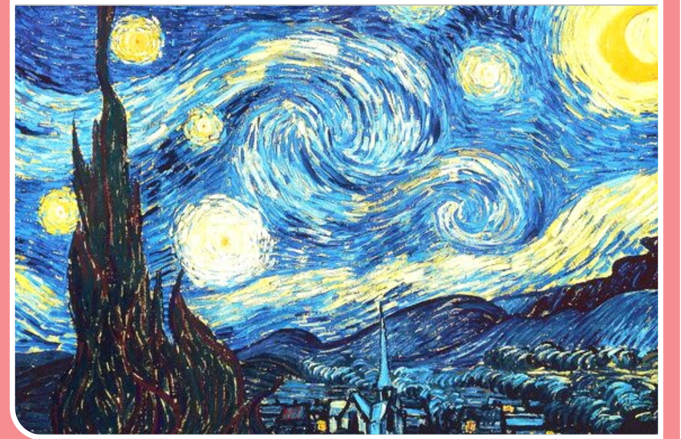
ایسنا | تابلو نقاشی «شب پرستاره» یکی از مشهورترین آثار هنری جهان است و در کنار تابلوهای نقاشی «شکوفه بادام» و «گل‌های آفتاب‌گردان» از آشناترین آثار «ون گوگ» به شمار می‌رود.