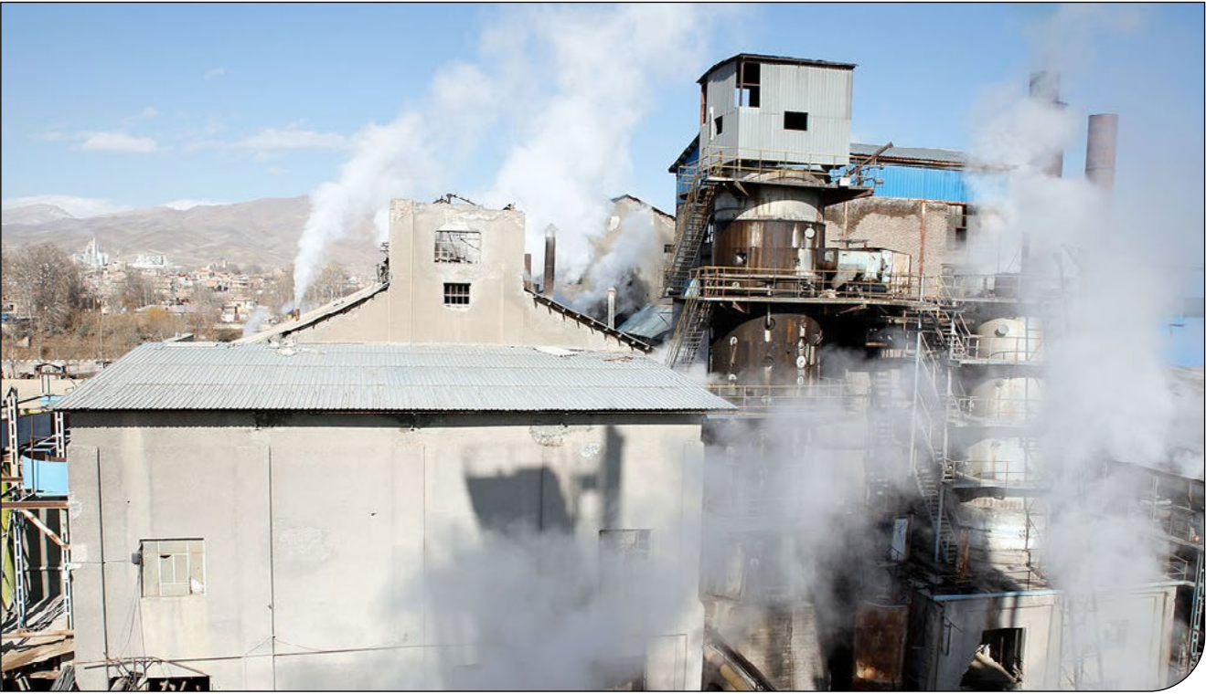
— تصویر —