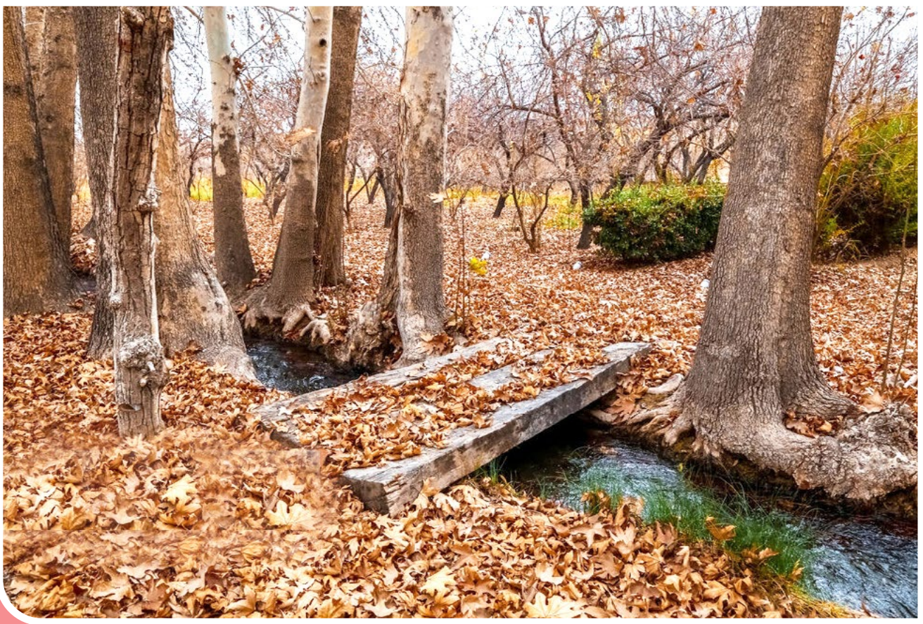
ایسنا | از بناهای تاریخی‌ای که طبیعت و هنر معماری را در کنار هم به خود اختصاص داده، باغ جهانی «پهلوانپور» مهریز (یزد) است طبیعت پاییزی این باغ جهانی نیز مانند سایر فصول سال دل‌انگیز و دیدنی است، برگ‌های زرد و سرخ چنارهای این باغ که در کنار جوی‌های آب قنات جهانی و معروف حسن‌آباد مشیر قد برافراشته‌اند، جلوه خاصی به این باغ داده‌اند.