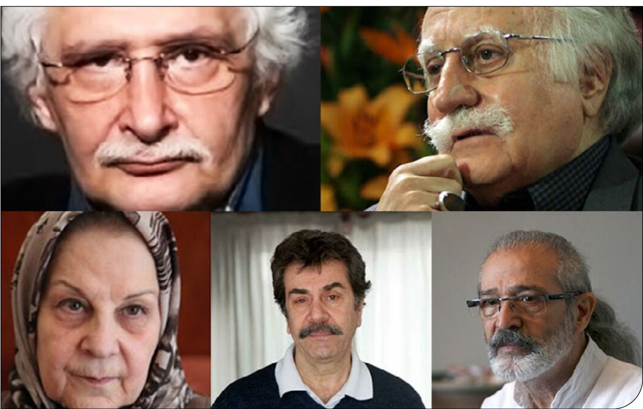
از چپ: ا.م.

به گفته او شیاری در بخش شمالی پل خاتون کرج ایجاد شده که علاوه بر رانش پل، احتمال ریزش دوباره را افزایش داده است.