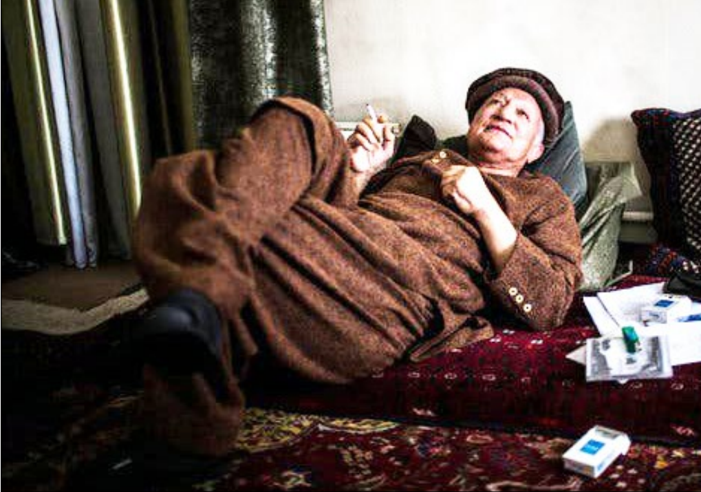
— تصویر تاپیر —

یادی از رهنورد زریاب، نویسنده بلند آوازه افغانستانی که بر اثر کرونا درگذشت