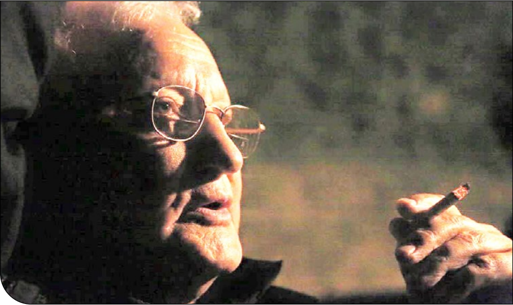
— پرویز شمال —

«استاد رهنورد زریاب از بزرگترین نویسندگان معاصر افغانستان در عرصه رمان، داستان کوتاه و نقد ادبی است. به جرات می‌توان گفت که یکی از شناخته‌شده ترین چهره‌های ادبیات معاصر افغانستان، رهنورد زریاب است. تاثیرگذاری او بر بخش‌های مختلف ادبیات افغانستان بر کسی پوشیده نیست.»