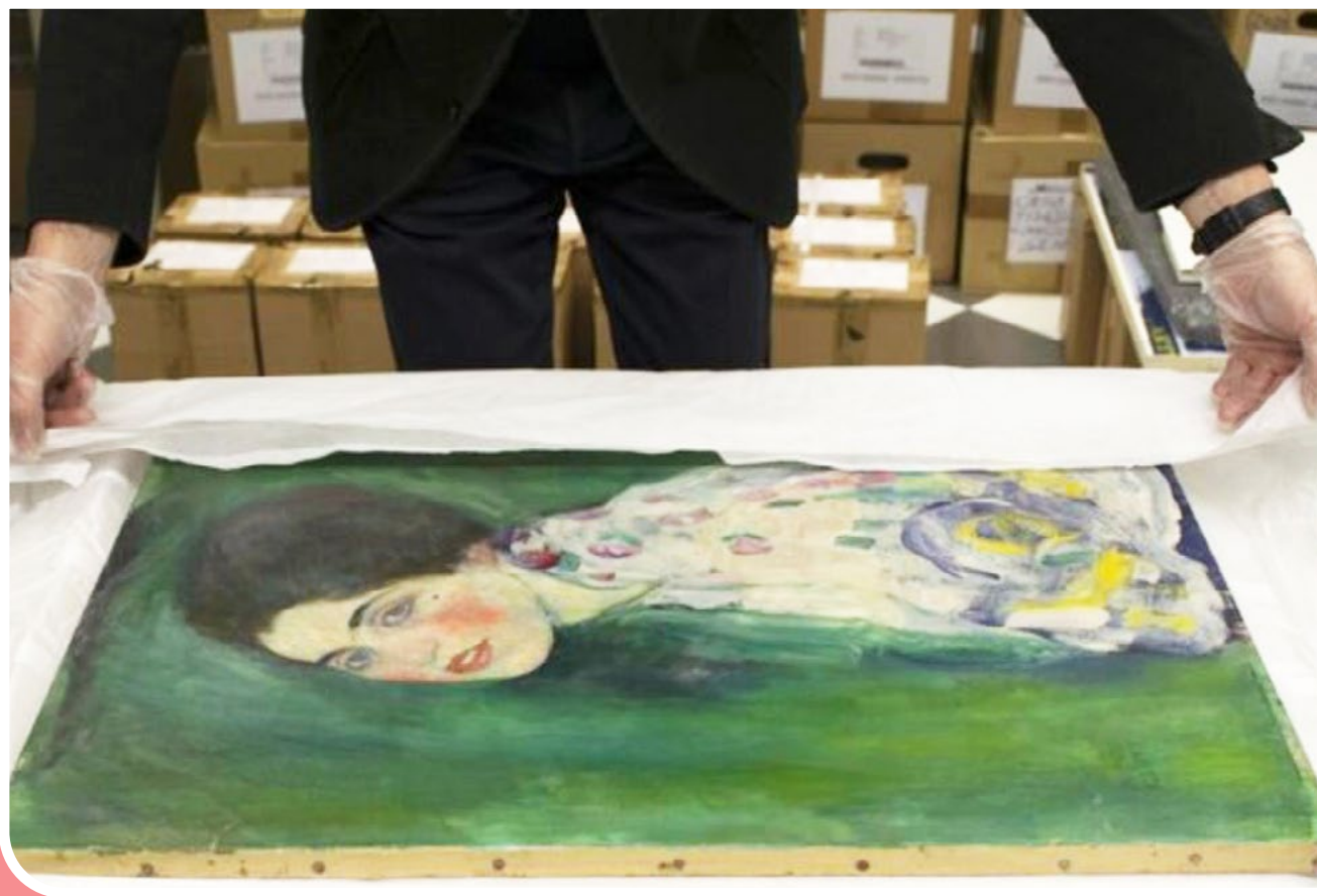
ایسنا | تابلو نقاشی اثر «گوستاو کلیمت» - هنرمند مشهور اتریشی - که پس از چندین دهه در محل سرقت کشف شده بود، بار دیگر در محل سابقش به نمایش درآمد.