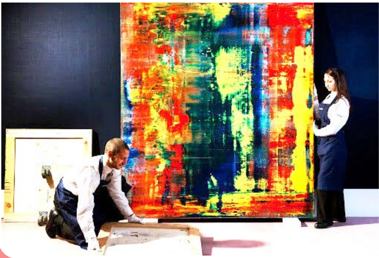
ایسنا | «گرهارد ریشر» به عنوان یکی از تأثیرگذارترین هنرمندان معاصر آلمانی و از گرانترین نقاشان زنده جهان که رکورد حراجی‌ها را بارها شکسته است، شناخته می‌شود. هنرمندی که سبک انتزاعی را زمره ارزشمندترین آثار جهان جای داد و آثارش را بر دیوار موزه‌ها و موسسات مطرح جهان می‌توان تماشا کرد.