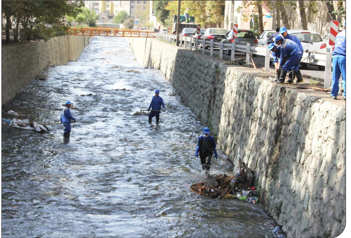
باشکوه بزرگ تهران

کانال‌های جمع‌آوری آب‌های سطحی باید جمع شود