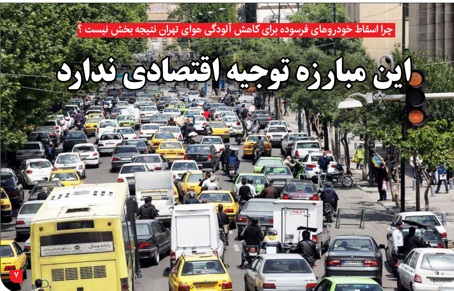
چرا اسقاط خودروهای فرسوده برای کاهش آلودگی هوای تهران نتیجه بخش نیست؟