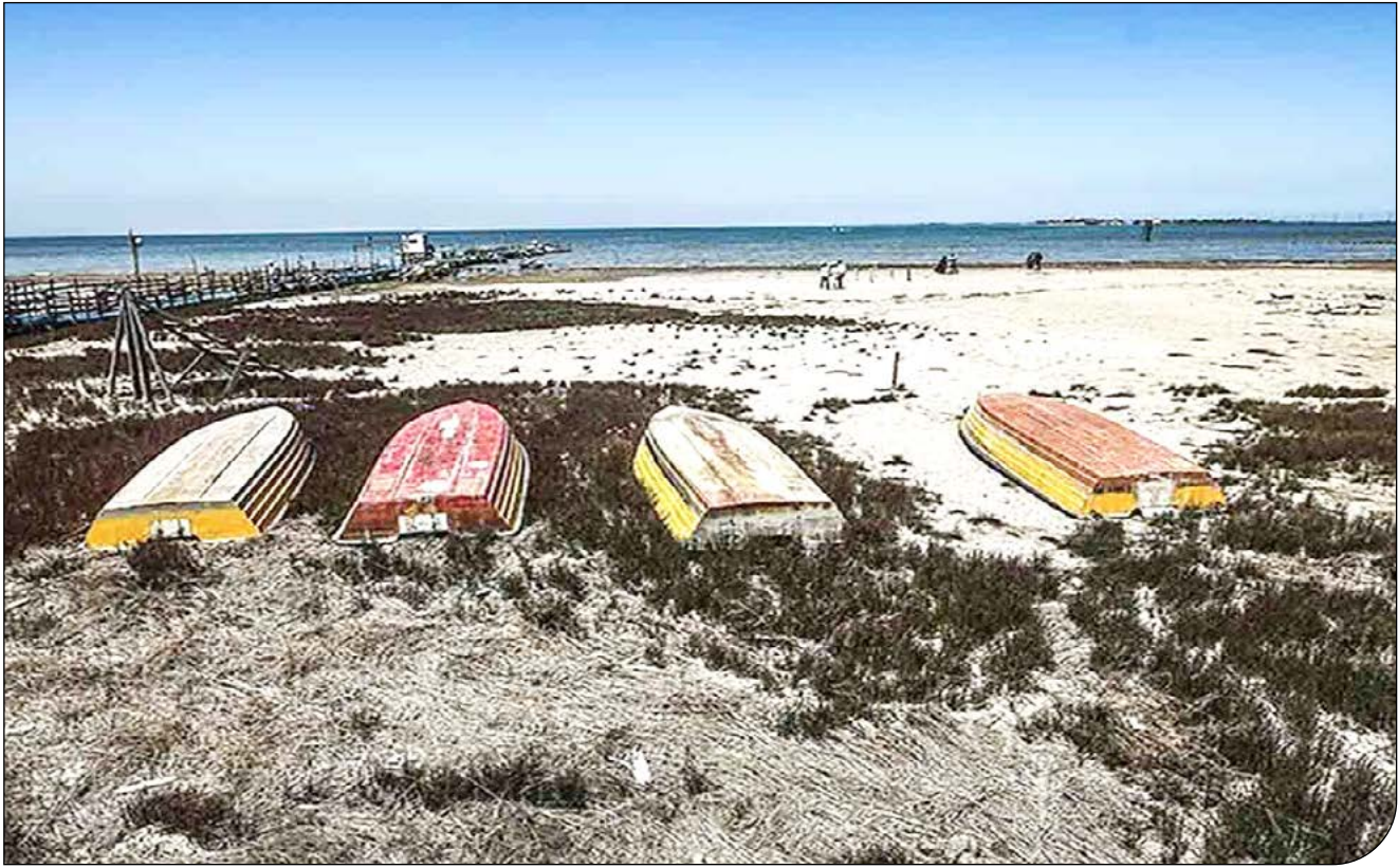
پاشنگاه در جزیره گرگان

کارشناس سازمان نقشه‌برداری: از ۴۰۰ کیلومتر مربع وسعت خلیج گرگان، بیش از ۱۰۰ کیلومتر مربع خشک شده است