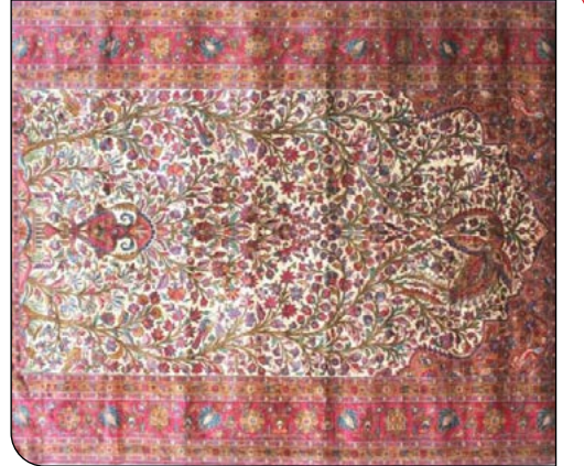
ایرنا | علی اصغر مونسان وزیر میراث فرهنگی، گردشگری و صنایع دستی در نامه‌ای به بهمن مرادیا استاندار کردستان، مراتب ثبت ۱۱ اثر منقول فرهنگی تاریخی را ابلاغ کرد.