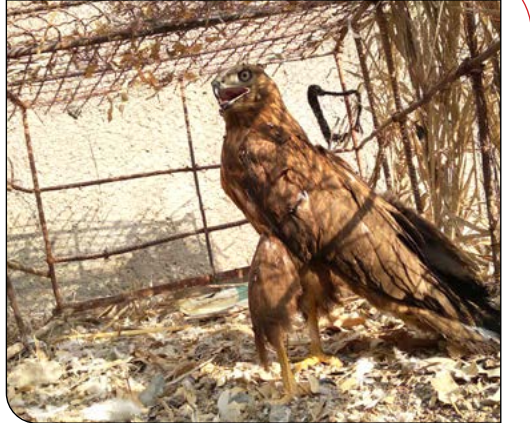
کنارصندل | به همت تعدادی از جوانان روستای باغبانویه در جیرفت، یک بهله عقاب زخمی برای مداوا و بازگشت به طبیعت به مسئول محیط زیست این شهرستان تحویل داده شد.