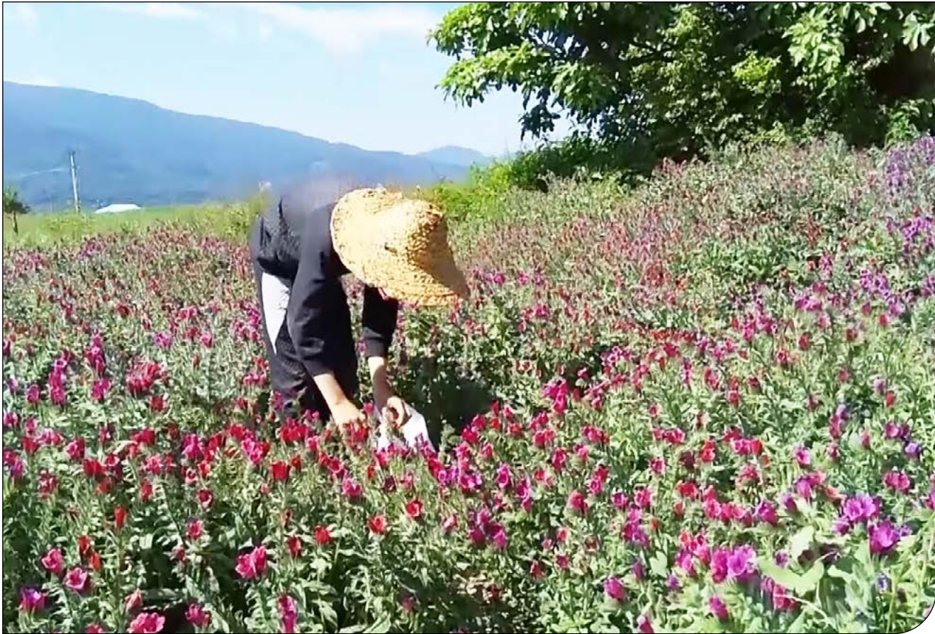
خیرگزاری صلواتی و سلفی