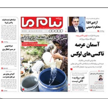
پایام ما دیروز