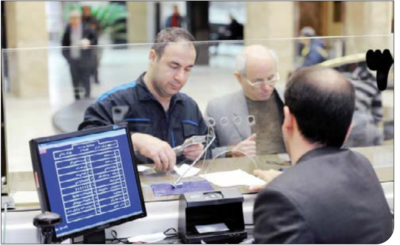
جلسه‌ای در بانک مرکزی

به گفته فعالان گردشگری، بانک‌ها همچنان نسبت به وجود چنین مصوبه و ابلاغیه‌ای ابراز بی‌اطلاعی می‌کنند