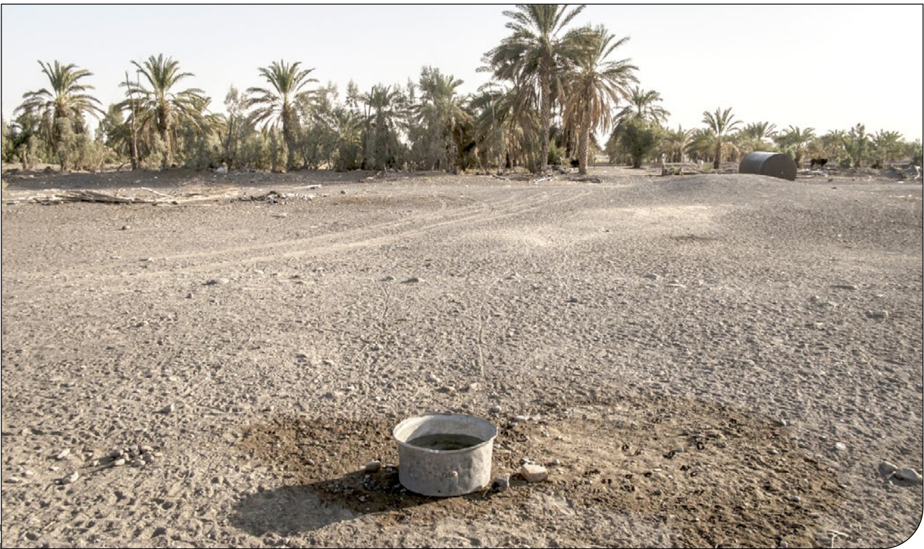
یک کوزه در یک زمین خشک

جغرافیای خشکسالی در ایران نشان می‌دهد تا پایان مردادماه امسال ۵/ ۷۲ درصد از مساحت حوضه‌های آبریز اصلی، دچار درجه‌های مختلفی از خشکسالی بلندمدت (۱۰ساله) شده‌اند