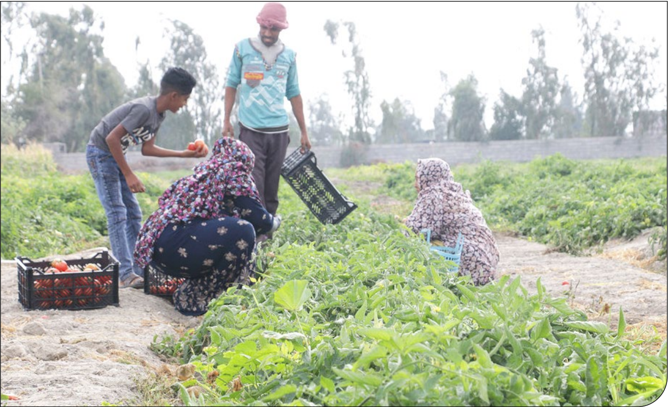
تولید کود شیمیایی در استان کرمان

با افزایش شدید قیمت کود و سایر نهاده‌های، صرفه اقتصادی کشاورزی از دست می‌رود