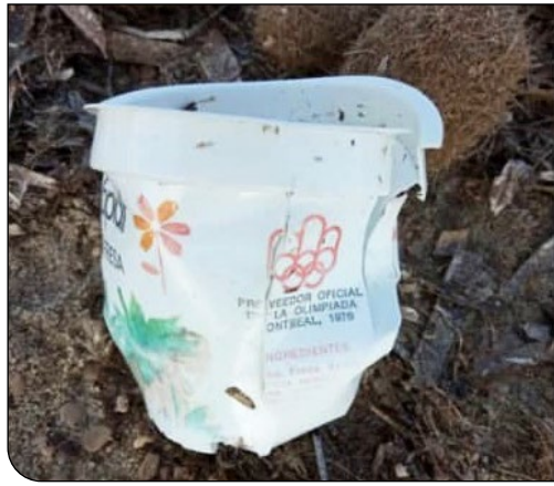
صفحه اکو دوست: لیوان مربوط به المپیک ۱۹۷۶ مونترال (۴۴ سال پیش)، پیدا شده در یک پاساژ در ساحل اسپانیا پیدا شده است.