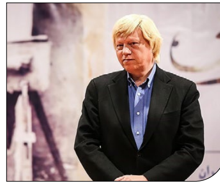
محمد بهشتی درباره پیامدهای همه‌گیری کرونا بر بخش میراث فرهنگی: