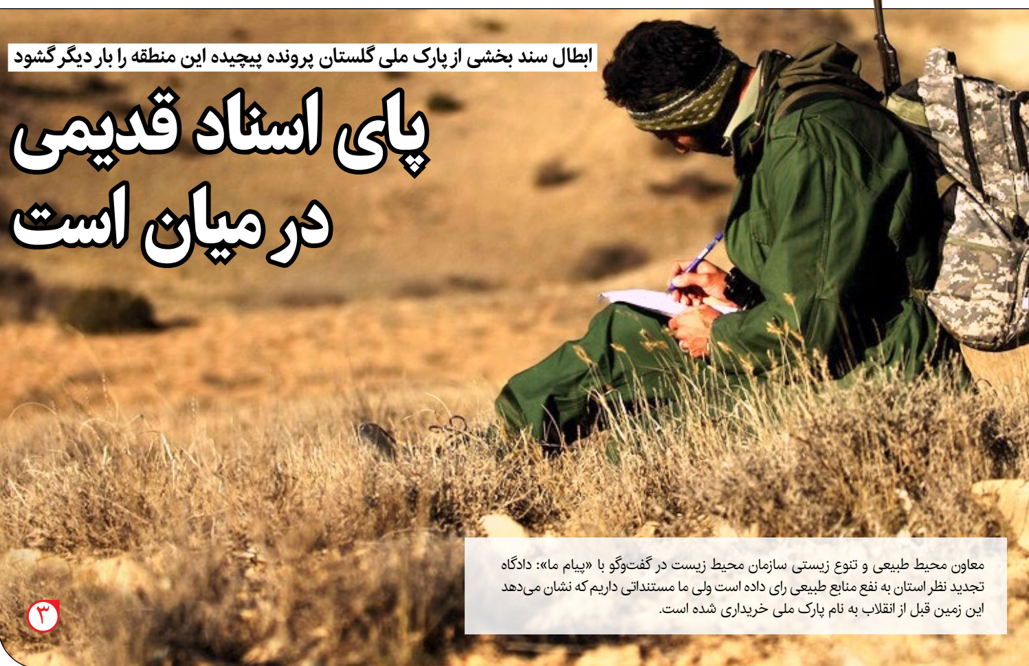
ابطال سند بخشی از پارک ملی گلستان پرونده پیچیده این منطقه را بار دیگر گشود