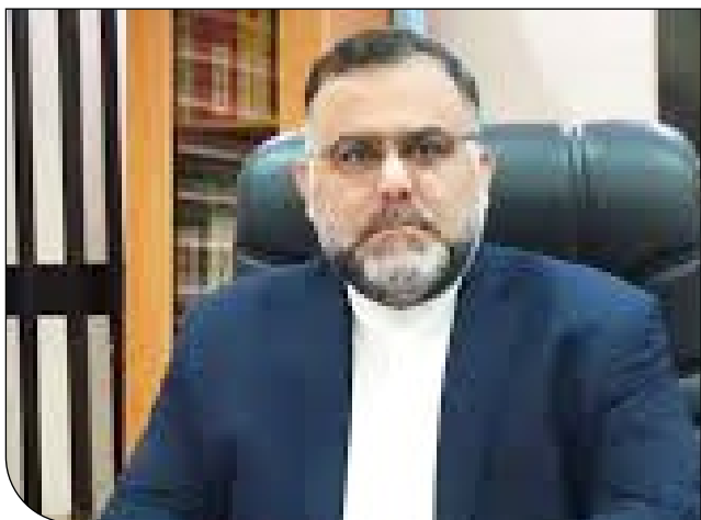
رئیس کل دادگستری خوزستان |

شبهه این روایت با تردیدهایی از سوی کاربران شبکه اجتماعی روبه‌رو شده است، از روایت