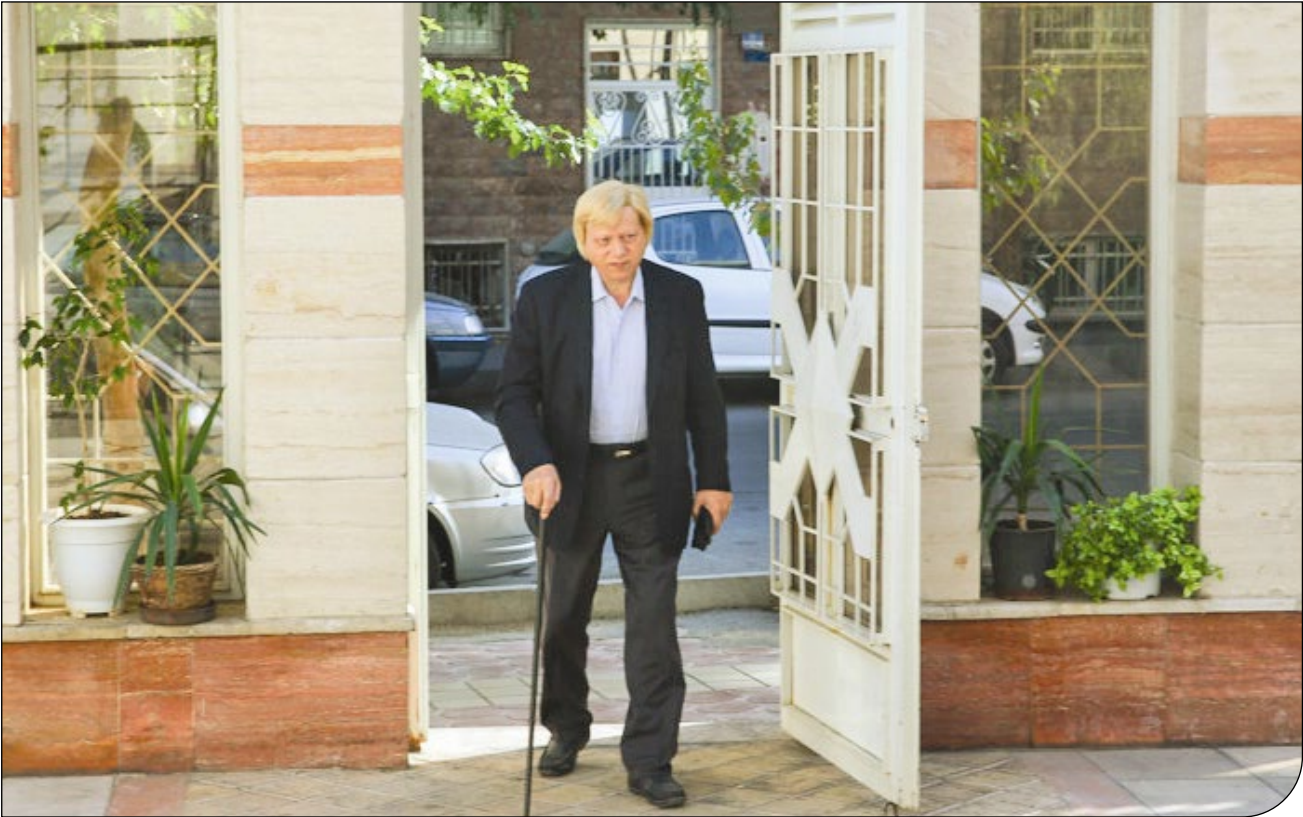
— عسکر، همشهری آملیان —

رئیس پیشین پژوهشگاه میراث فرهنگی در همایش ملی پیامدهای اجتماعی و فرهنگی کرونا بر میراث فرهنگی