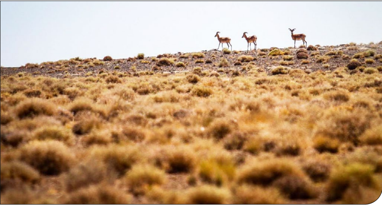
سه گوزن در پارک ملی گلستان

معاون محیط طبیعی و تنوع زیستی سازمان محیط زیست در گفت‌وگو با «پیام ما»: دادگاه تجدید نظر استان به نفع منابع طبیعی رای داده است ولی ما مستنداتی داریم که نشان می‌دهد این زمین قبل از انقلاب به نام پارک ملی خریداری شده است