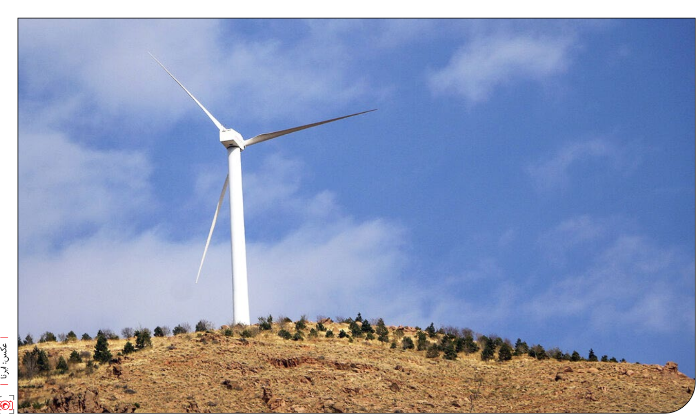
— تصویر: —

ایران و افغانستان درباره استفاده از انرژی باد مذاکره می کنند