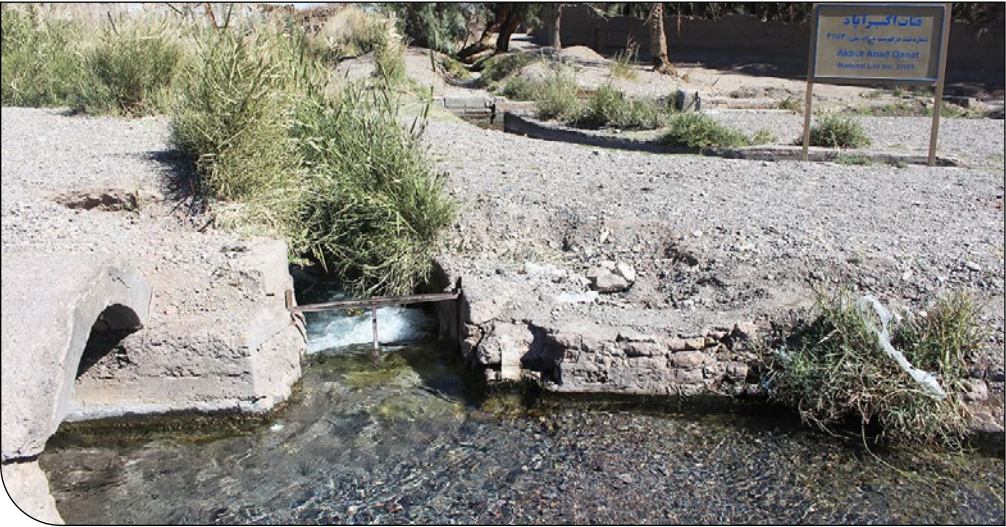
عکس: ایسنا | [۵]

مدیر پایگاه میراث جهانی قنات‌های ایران در این خصوص گفته است: «نیروی متخصص در استان‌ها کم داریم و اگر بخواهیم مدیری را جایجا کنیم با کمبود نیروی انسانی متخصص در وزارتخانه میراث و گردشگری روبه‌رو هستیم. دعوت از نیروی متخصص خارج از وزارت‌خانه نیز ملزم به تأمین منابع مالی است که وجود ندارد.»