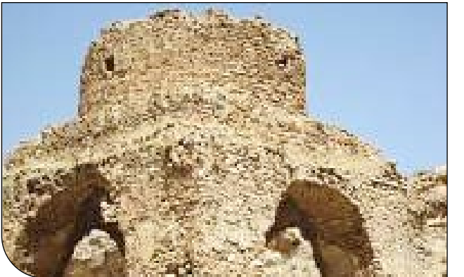
عکس: ایسنا | [۵]