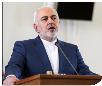
وزیر امور خارجه:

مذاکرات درباره سانحه هواپیمایی اوکراینی با همکاری به نتیجه می رسد