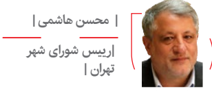
| محسن هاشمی |

رییس شورای شهر تهران با بیان اینکه در فصل پاییز قرار داریم و تردد خودروها باعث آلودگی هوا می‌شود که تاثیر جدی بر اینجانب سلامت گروه‌های مختلف دارد به گرانی و دغدغه معیشت و بهداشت