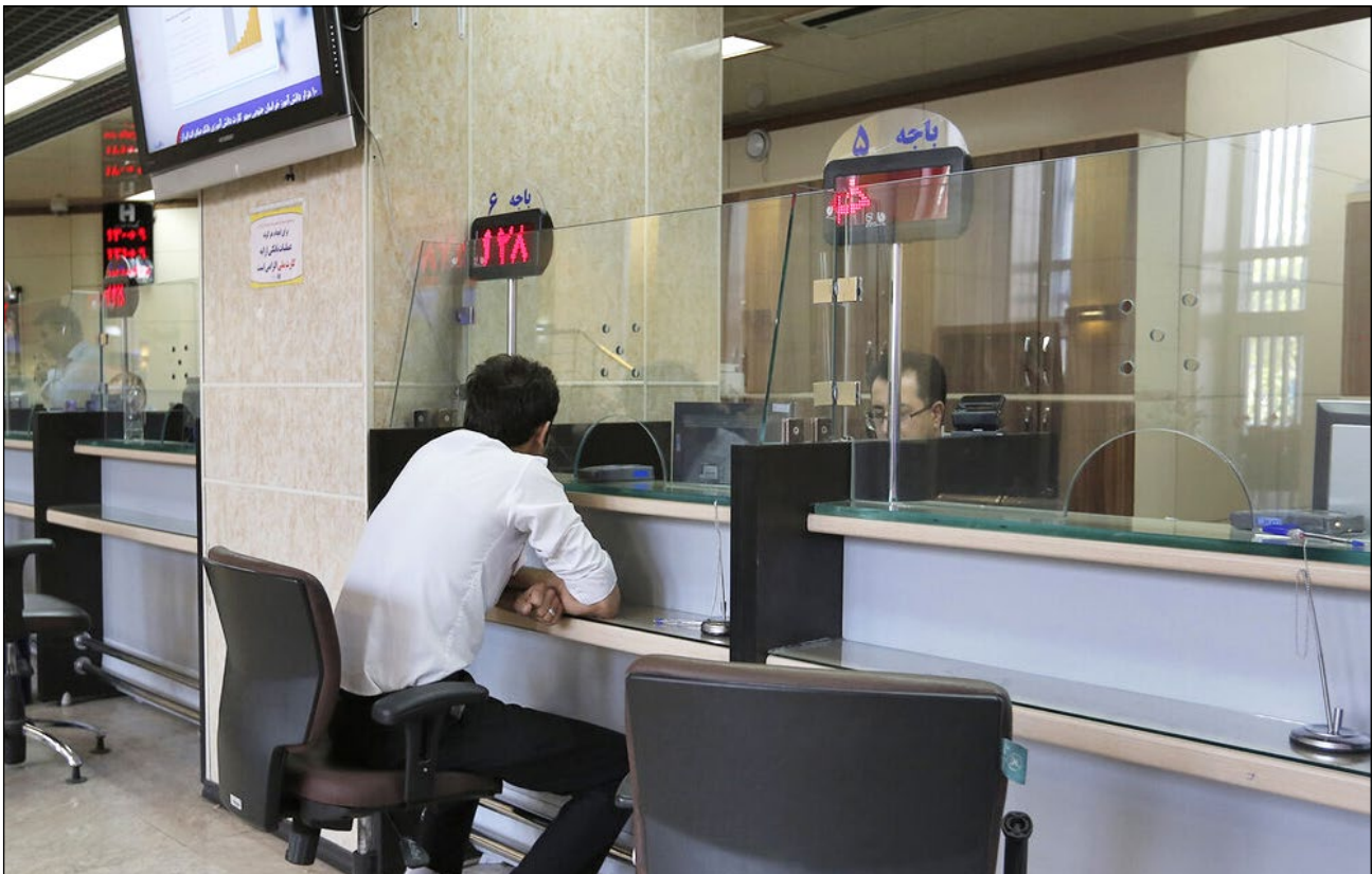
علی اصغر مونسان - وزیر میراث فرهنگی

سرپرست هیات باستان‌شناسی گورستان مرسین از کشف سفالینه‌هایی از دوره‌های عصر آهن و دوره پیش از مادها از گورستان باستانی مرسین خبر داد و گفت: یافته‌های گورستان مرسین نقش مهم و موثری در کسب اطلاعات بیشتر در مورد زندگی ساکنان فلات ایران پیش از برآمدن شاهنشاهی‌های بزرگ ماد و هخامنشی دارد. مهرداد ملک زاده با اعلام این خبر گفت: در کاوش‌های اخیر نمونه‌های ارزشمندی از سفالینه‌های معروف به "سفال نخودی غربی جدید" که نشانگر آثار عصر آهن یا دوره ماد است کشف شده است. او با اشاره به اینکه تا کنون نزدیک ۳۵ گور حفاری شده است، گفت: این گورستان یافته‌های ارزشمندی داشته که تعدادی از آثار در موزه سمنان به نمایش درآمده است. ملک زاده بیان کرد: بر اساس آزمایش‌های رادیو کربن در سال ۱۳۹۳ مشخص شد، یافته‌های این گورستان به حدود ۴۵۰ قبل از میلاد برمی‌گردد و این یافته‌ها نقش مهمی در بازسازی زندگی و طرز معیشت اواخر دوره ماد و اوایل دوره هخامنشی دارد. او با تاکید بر اینکه این یافته‌ها نقش موثری در رونق گردشگری و شناخت فرهنگ منطقه سمنان دارد، گفت: این فصل از کاوش تا اواخر مهرماه ادامه دارد و باید در سال آینده نیز ادامه داشته باشد.