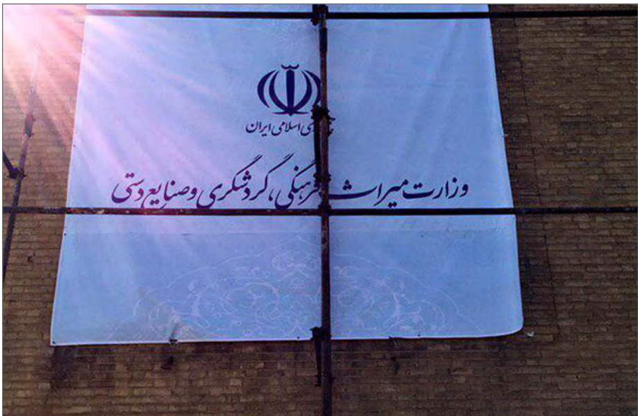
وزارت میراث فرهنگی حدود هفت میلیارد تومان را برای فعالیت‌های بازاریابی، تبلیغات و آشناسازی در ۱۲ کشور و ۳۱ استان اختصاص داده است

پرداخت هفت میلیارد تومان به تشکل‌های خصوصی گردشگری، در شرایطی که برخی به آن نسبت «حق