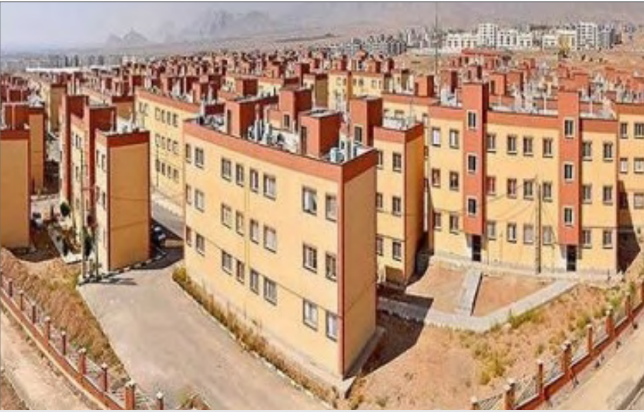
بانک مسکن با هدف ایجاد ظرفیت‌های مولد در تأمین مالی بخش مسکن، انتشار اوراق رهنی منتشر می‌کند