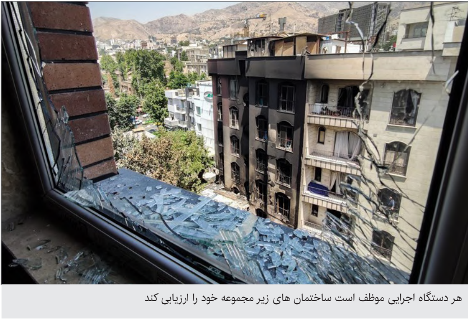
هر دستگاه اجرایی موظف است ساختمان های زیر مجموعه خود را ارزیابی کند