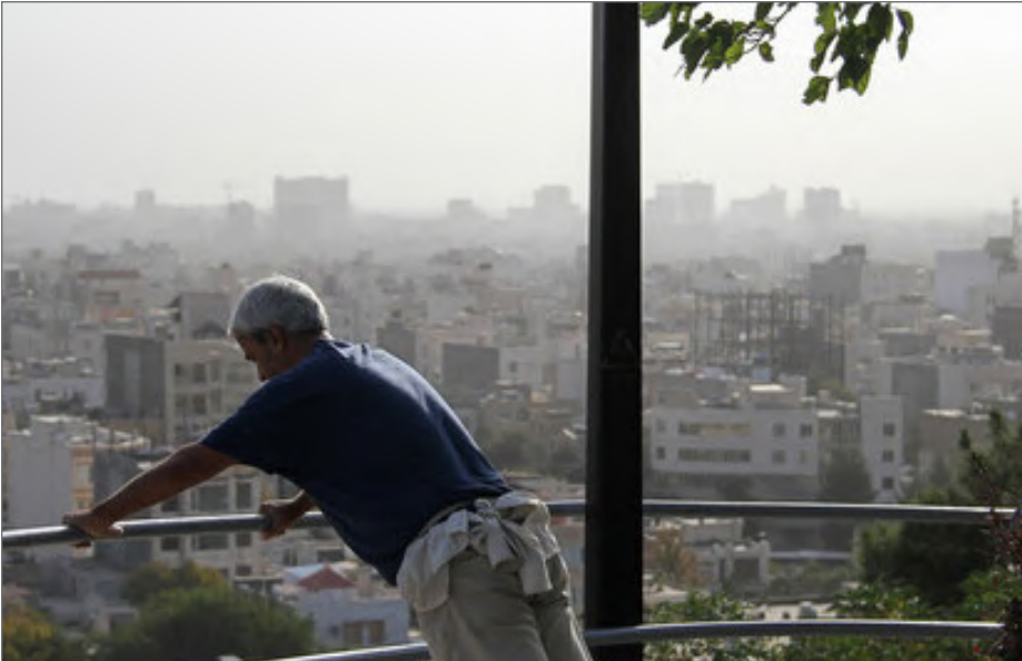
افزایش مونو اکسید کربن و دی اکسید گوگرد در هر روز، به طور معنی‌داری سبب افزایش میزان مرگ‌ومیر به دلایل بیماری‌های تنفسی می‌شود

شاخص‌های آلودگی شامل ذرات معلق کوچک‌تر از ۱۰ و ۲.۵ میکرون، مونواکسید کربن، اکسیدهای گوگرد و ازن نیتروژن، دی‌اکسید گوگرد و ازن بودند که از ایستگاه‌های مختلف این ۶ شهر جمع‌آوری شدند. همچنین اطلاعات روزانه مرگ‌ومیر ناشی از بیماری‌های قلبی-عروقی،