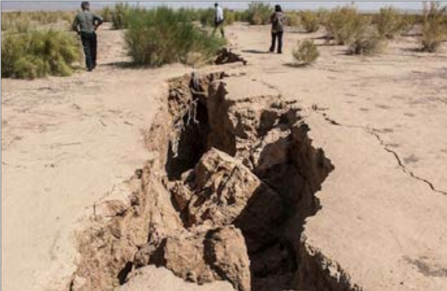
استان‌های «تهران» و «اصفهان» از جمله حادث‌ترین محدوده‌های کشور از نظر نرخ فرونشست است

رییس سازمان نقشه‌برداری کشور از شناسایی ۴۴ محدوده پرخطر به لحاظ میزان نرخ فرونشست توسط این سازمان خبر داد و گفت: استان‌های تهران و اصفهان از جمله حادث‌ترین مناطق از نظر نرخ فرونشست است؛ از این رو نسبت به تهیه اطلس فرونشست کشور اقدام کردیم. دکتر مسعود شفیع ی در گفت‌وگو با ایسنا، زلزله، آتشفشان، سیل و فرونشست زمین را از جمله مخاطرات طبیعی ایران نام برد و گفت: در دو سال اخیر، مطالعات تعیین نرخ فرونشست به ما سپرده شده و سازمان نقشه‌برداری کشور بر پایه اندازه‌گیری‌ها و داده‌های خود طی ۱۵ سال اخیر ۴۴ محدوده پرخطر در کشور را شناسایی کرده است.وی فرونشست را ایجاد تغییرات ارتفاعی بر روی زمین دانست و یادآور شد: پس از شناسایی محدوده‌های فرونشست، زمین‌شناسان براساس این داده‌ها، میزان خطر و اینکه آیا احتمال ایجاد فروچاله وجود دارد یا خیر را مورد تحلیل قرار می‌دهند.