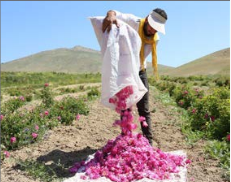
کشت و صنعت گل‌محمدی؛ در کنار یکدیگر

افزایش سطح زیر کشت گل‌محمدی از ۵۲ هکتار در سال ۸۴ به ۲۵۰ هکتار طی سه سال گذشته در این استان با تولید حدود ۳۲۰ تُن و ارایه تسهیلات کم‌بهره، نشان از نگاه ویژه دولت به توسعه کشت گیاهان دارویی و اصلاح الگوی