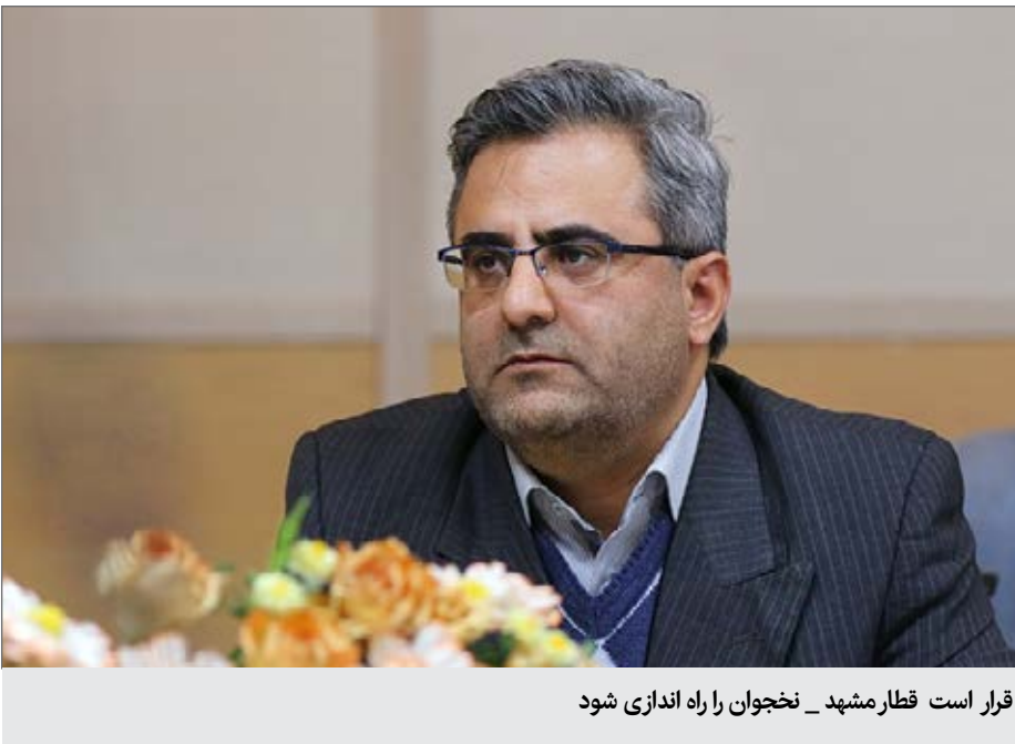
قرار است قطار مشهد _ نخجوان را راه اندازی شود