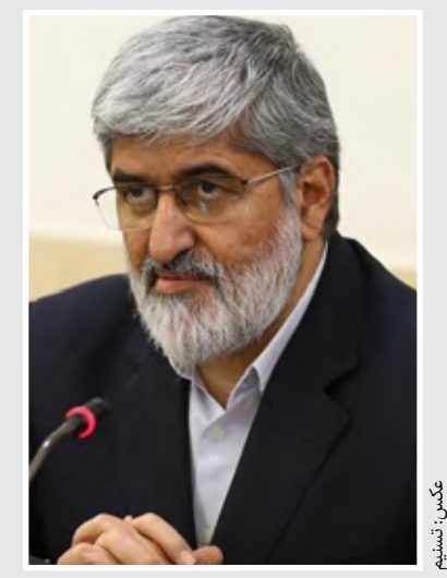
علی مطهری: دست از حمله به ظریف بردارید