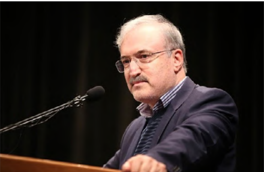
وزیر بهداشت: طرح سلامت روان جامعه محدود به بیماری خاصی نیست

وزیر بهداشت، درمان و آموزش پزشکی از اجرای طرح ادغام شبکه پایش سلامت روان جامعه در نظام درمانی کشور خبر داد. سعید نمکی (وزیر بهداشت، درمان و آموزش پزشکی) در گفت‌وگو با خبرنگار ایلنا در ارتباط با بسیج ملی آمایش بیماری‌های اعصاب و روان در سطح کشور گفت: از برنامه‌های پیش روی ما بحث mental health یا همان سلامت روان جامعه است که آمایش آن به شیوه بسیج ملی و با همان شیوه که پیشتر آمایش فشار خون عمومی صورت گرفت، قرار دارد.