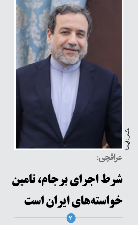
عراقچی: شرط اجرای برجام، تامین خواسته‌های ایران است