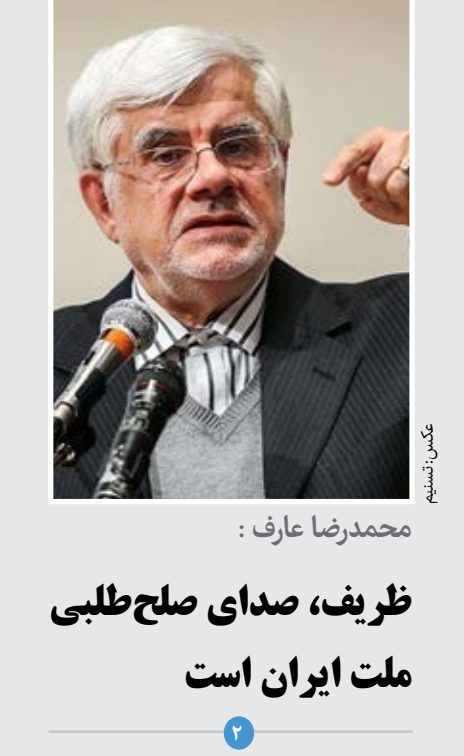
محمدرضا عارف : ظریف، صدای صلح طلبی ملت ایران است

تپه هگمتانه ثبت جهانی می شود ثبت جهانی تپه هگمتانه اولویت سازمان میراث فرهنگی شد