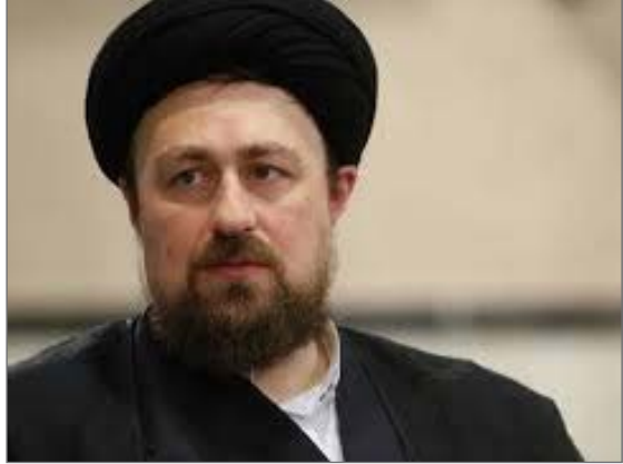
سید حسن خمینی

یادگار امام خمینی (ره) در تماس تلفنی با«محمدجواد ظریف» ضمن محکومیت اقدام اخیر آمریکا تاکید کرد: مردم به شما اعتماد دارند و باوجود ادعاهای بی‌اساس آمریکایی ها، همگان می‌دانند که شما مسئول اصلی سیاست خارجی ایران هستید و تاکنون نیز آن را به خوبی پیش برده‌اید.