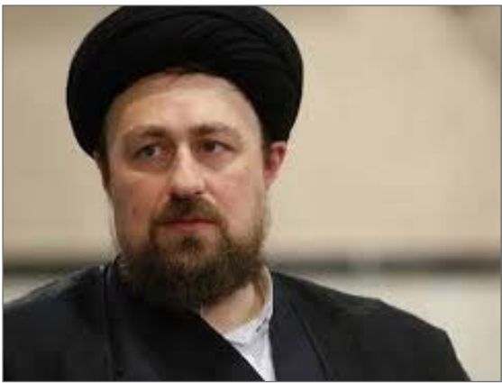
سید حسن خمینی

یادگار امام خمینی (ره) در تماس تلفنی با«محمدجواد ظریف» ضمن محکومیت اقدام اخیر آمریکا تاکید کرد: مردم به شما اعتماد دارند و باوجود ادعاهای بی‌اساس آمریکایی ها، همگان می‌دانند که شما مسئول اصلی سیاست خارجی ایران هستید و تاکنون نیز آن را به خوبی پیش برده‌اید.