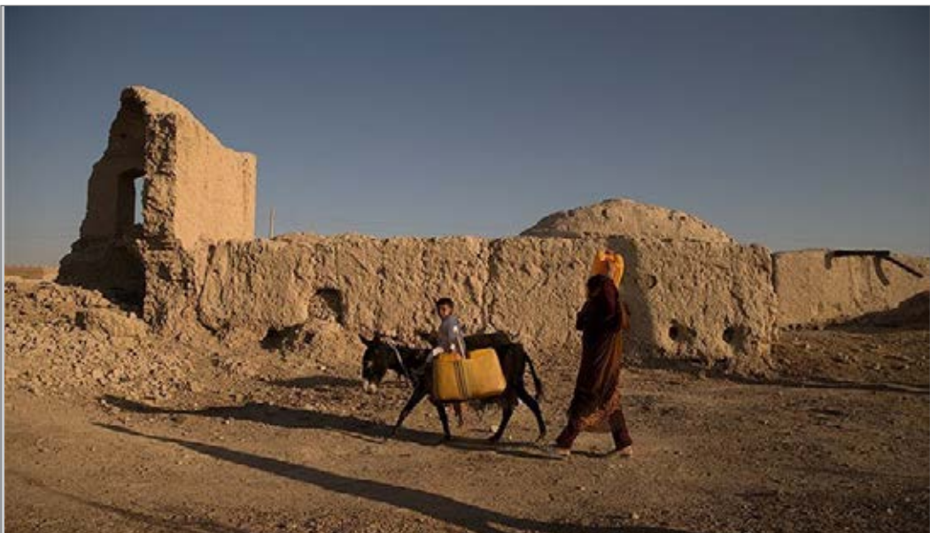
زندگی سخت مردم سیستان در خشکسالی

ایران بر روی کمربند گرم و نیمه خشک قرار دارد و مشکل آب و کمبود خشکسالی همیشه در تاریخ ایران بوده است. نمونه استناد به تاریخ