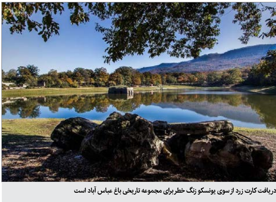
دریافت کارت زرد از سوی یونسکو زنگ خطر برای مجموعه تاریخی باغ عباس آباد است