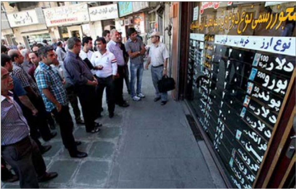
در هفته‌های اخیر تقاضا برای خرید ارز از بازار بسیار کمتر شده است

برای کنترل بازار ارز حالا نرخ ارز روندی کاهشی به خود گرفته است و این روزها قیمت دلار حتی تا کانال ۹۰۰۰ تومان هم نزول پیدا کرده است. در همین باره وزیر امور اقتصادی و دارایی در نشستی با هیات نمایندگان اتاق بازرگانی ایران به تزییق ۶۰ میلیون یورویی در سامانه نیما اشاره کرده و گفته که «بازار ارز به سمت و سوی متعادل شدن حرکت کرده است. به دنبال آن ورود