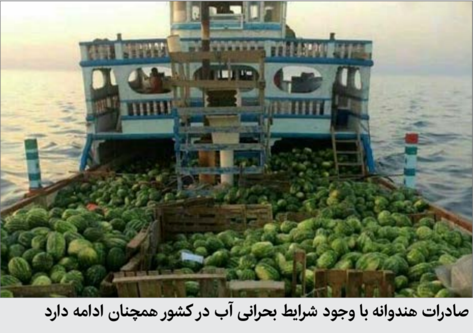
صادرات هندوانه با وجود شرایط بحرانی آب در کشور همچنان ادامه دارد

هندوانه در بین نخستین محصولات صادراتی کشاورزی قرار گرفته. این در حالی است که تولید این محصول آب بسیار زیادی می‌برد و در شرایطی که شهرپور سال گذشته وزارت جهاد کشاورزی اعلام کرد برای تولید هر کیلوگرم هندوانه، به ۲۸۶ لیتر آب نیاز است. براساس اظهارات وزیر کشاورزی اعلام کرد برای تولید هر کیلوگرم هندوانه، به ۲۸۶ هزار تومان نیاز است. با احتساب دلار ۴۲۰۰ تومانی، هر کیلو هندوانه ۲۸۶ هزار تومان است. با احتساب دلار ۲۸ سنت وارد دلار می‌شود. این در حالی است که صادراتی کشاورزی جایگاه اول را دارد. جایگاهی که البته نمی‌تواند مایه دلخوشی باشد چراکه محاسبات