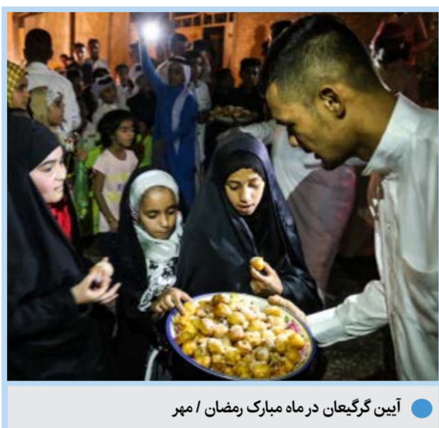
آیین گریه‌بان در ماه مبارک رمضان / مهر