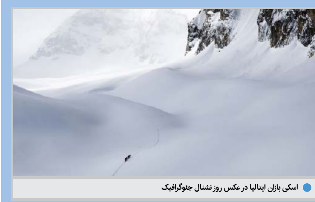
اسکی بازان ایتالیا در عکس روز نشنال جئوگرافیک