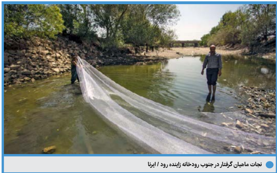
نجات ماهیان گرفتار در جنوب رودخانه زاینده رود / ایرنا