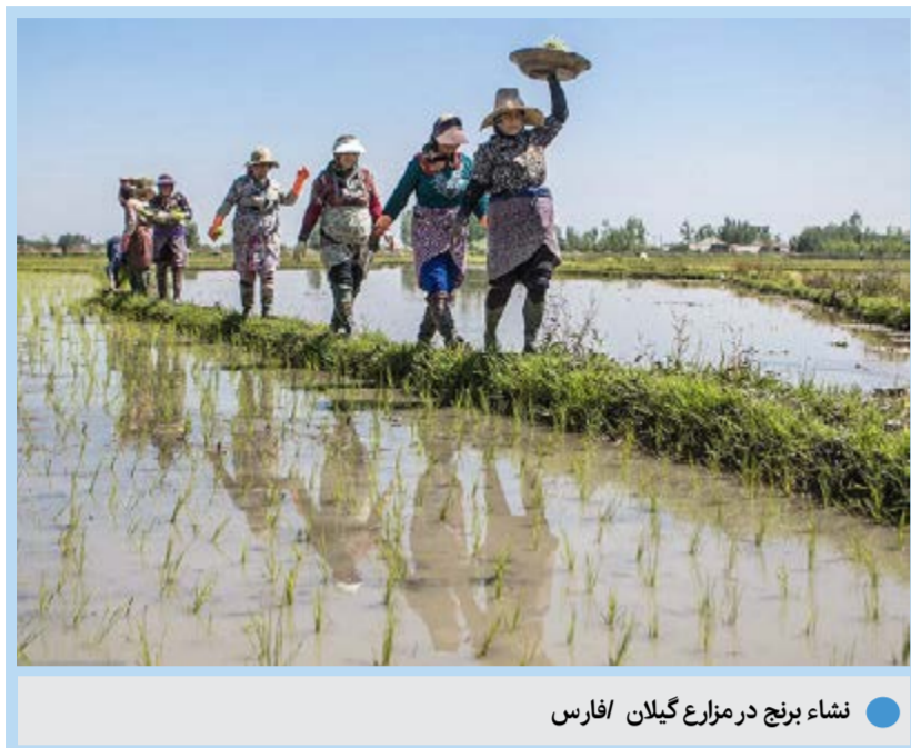
نشاء برنج در مزارع گیلان