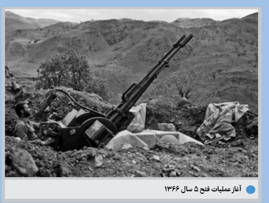
آغاز عملیات فتح ۵ سال ۱۳۶۶