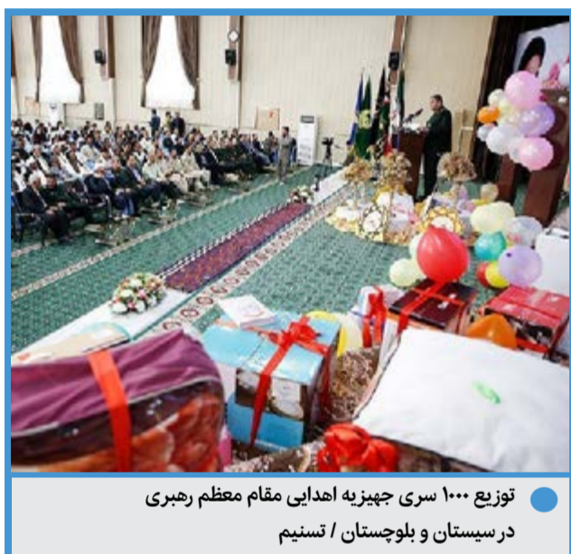
توزیع ۱۰۰۰ سری جهیزیه اهدایی مقام معظم رهبری در سیستان و بلوچستان