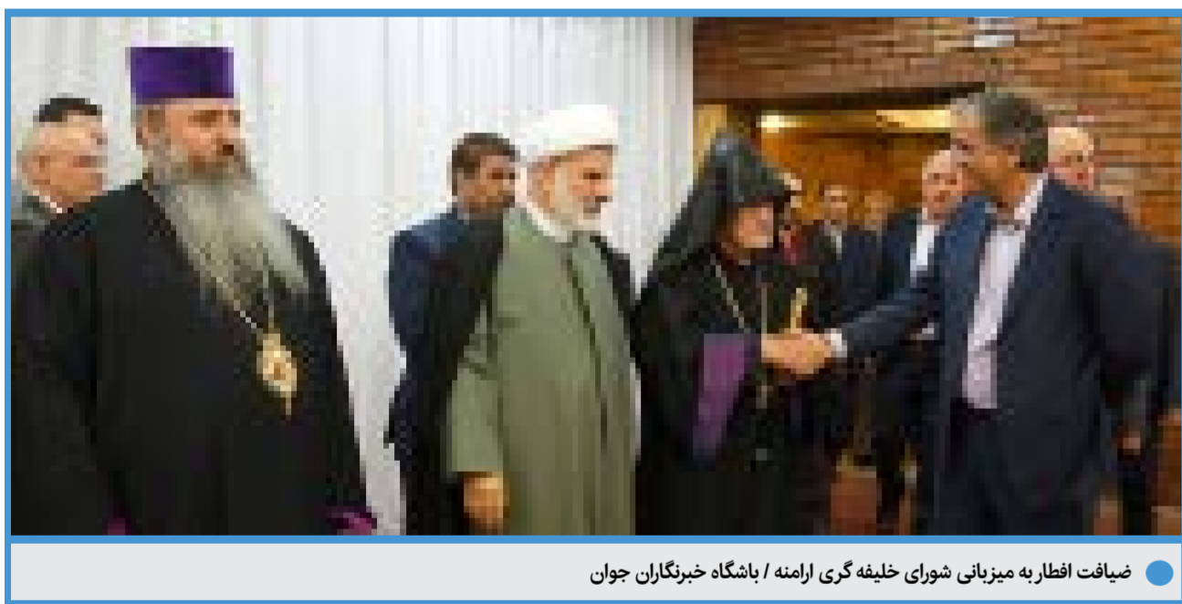
ضیافت افطار به میزبانی شورای خلیفه گری ارمنه