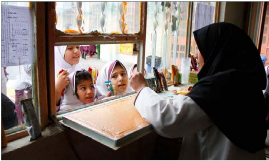
تشکیل کمیته مبارزه با کالاهای آسیب‌رسان به دلیل زلزله‌های اخیر به تعویق افتاد

گلزاری به پیام ما می‌گوید: دانشگاه علوم پزشکی واداره کل آموزش و