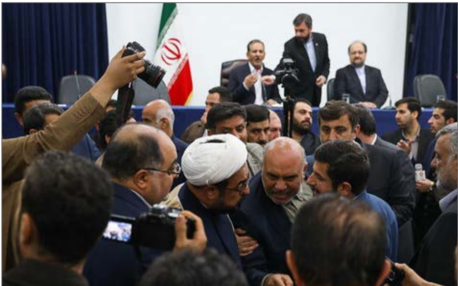
اعتراض نمایندگان خوزستان به رییس سازمان حفاظت محیط زیست

در برابر خانم ابتکار ارزشی ندارید، با این تصمیم گیری هایتان». کلانتری در پاسخ می‌گوید: «به تو هیچ ربطی ندارد». تنش در جلسه شورای اداری خوزستان و جروبحث برخی نمایندگان خوزستان با رییس سازمان حفاظت محیط زیست در حالی به وقوع پیوست که معصومه ابتکار، رئیس پیشین سازمان حفاظت محیط زیست و از مخالفان طرح انتقال آب بهشت آباد و انتقال بین حوضه ای در بهمن ماه سال گذشته گفته بود: «طرح های انتقال آب کارون هیچ مجوزی از سازمان حفاظت محیط زیست ندارند». از سوی دیگر هفته گذشته نیز عیسی کلانتری رئیس سازمان حفاظت محیط زیست، خطاب به اسحاق جهانگیری معاون اول رئیس جمهور نامه ای به تاریخ ۹۶/۸/۱۴ و به شماره