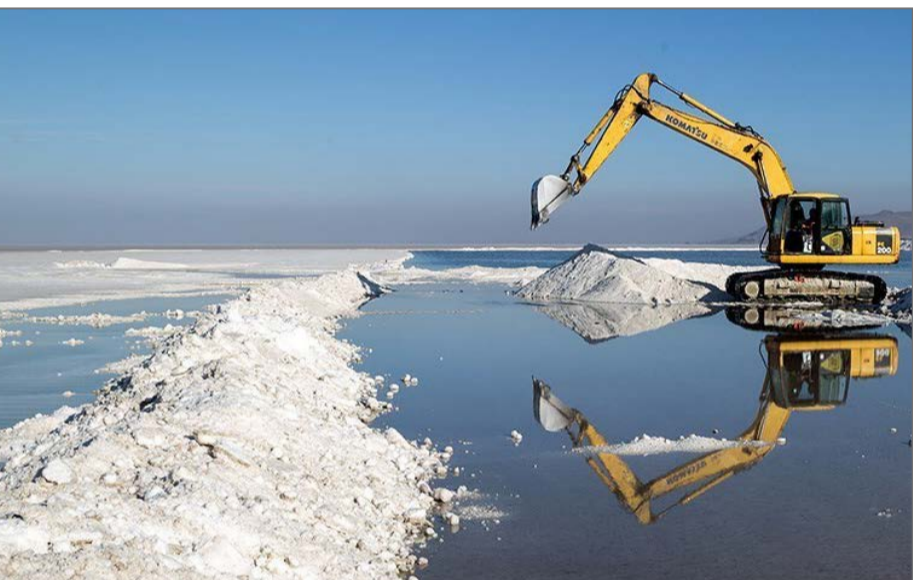
دریاچه ارومیه از اواسط دهه ۱۳۸۰ شمسی شروع به خشک شدن کرد