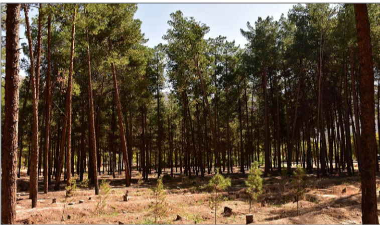
پایین آمدن کیفیت آب کرمان درختان شهر را با خطر مواجه کرده است.

ثروت ملی و سرمایه سبز کرمانی‌ها، یکی از زیباترین جاذبه‌های گردشگری شهر و جنگلی با نیم میلیون اصله درخت که به ریه شهر شهرت یافته است، نیازمند رسیدگی و توجه بیشتری است تا به سرنوشتی همچون نارون‌های خیابان جمهوری دچار نشود.