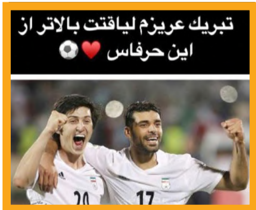
سردار آزمون با انتشار عکسی در استوری خود به مهدی طارمی بابت انتخابش به عنوان مرد سال فوتبال ایران تبریک گفت.

محمود افشاردوست، دبیر فدراسیون والیبالیست ها در این باره می گوید: «من صحبت های معروف را دقیق خواندم چون اصلاً صفحه او را در اینستاگرام ندارم! با این حال از طریق سرپرست تیم ملی پیگیر این ماجرا می شوم چون شاید خوش خبر در این باره با معروف صحبت کرده باشد.» وی همچنین می افزاید: «اصلاً نمی دانم چه فکری پشت این انتقادات معروف بوده و او چه کسی را خطاب قرار داده است. البته به سایر بازیکنان که عکس غلامی را در صفحه خود قرار دادند نمی توان خرده گرفت چون آنها سال ها با یکدیگر هم تیمی بودند.»