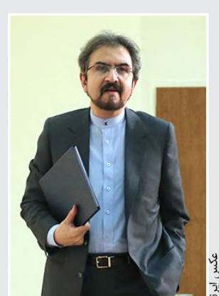
سخنگوی وزارت خارجه:

در مقابل نقض برجام توسط آمریکا سکوت نمی کنیم