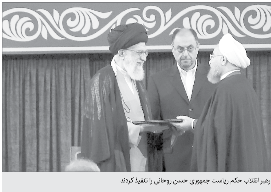
رهبر انقلاب حکم ریاست جمهوری حسن روحانی را تنفیذ کردند

مراسم تنفیذ حکم ریاست جمهوری صبح پنج شنبه در حسینیه امام خمینی(ره) برگزار شد و رهبر انقلاب اسلامی با تنفیذ رأی ملت، حجت الاسلام والمسلمین دکتر حسن روحانی را به ریاست جمهوری اسلامی ایران منصوب کردند. رهبری در این حکم، انتخابت پر شور و رأی بالای شخصیت منتخب را نشانه تحکیم جمهوریت نظام خواندند و با تأکید بر اجرای برنامه اقتصاد مقاومتی، به رییس‌جمهور توصیه کردند که همت خود را متوجه استقرار عدالت، و جانبداری از محرومان مستضعف، و اجرای احکام اسلام ناب، و تقویت وحدت و عزت