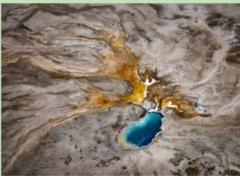
پارک ملی یلوستون