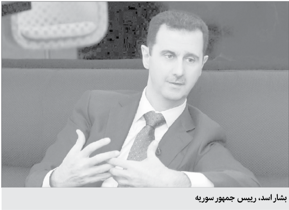
بشار اسد، رئیس جمهور سوریه

و گروه های مشابه آنها در وضعیت عقب گرد هستند. وی اظهار کرد، کشورهای چون عربستان، قطر، ترکیه، ایالات متحد، فرانسه و انگلیس با هدف اجرای دستورکارهای سیاسی، از تروریسم حمایت می کنند. اسد با تاکید بر اینکه سوریه هیچ سلاح شیمیایی ندارد، گفت که سوریه دیگر تاسیسات لازم برای این منظور را ندارد و جان کری، وزیر خارجه سابق آمریکا نیز به این امر اذعان کرد. وی خاطرنشان کرد: وضعیت از لحاظ نظامی در میدان نبرد بسیار بهتر از گذشته شده است، اما این امر به صورت کامل تصویبی را از اوضاع ارائه نمی دهد چراکه اوضاع محدود به درگیری های نظامی نیست بلکه مسائل مختلفی همچون ایدئولوژی