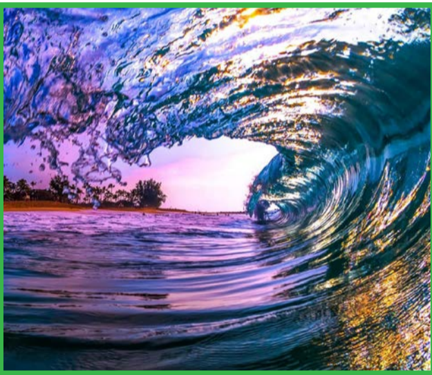
زیبایی امواج در هاوایی