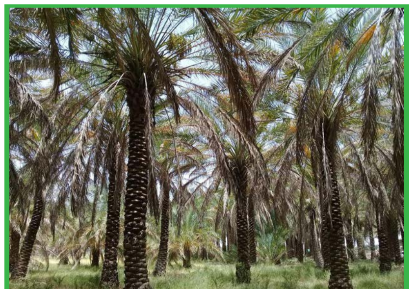
خرمای جنوب استان کرمان بر اثر تنش های محیطی، پیش از موعد می ریزد/ پیام ما