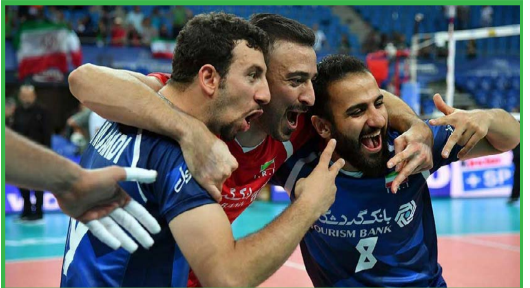
اولین پیروزی ایران در لیگ جهانی والیبال مقابل لهستان/ میزان