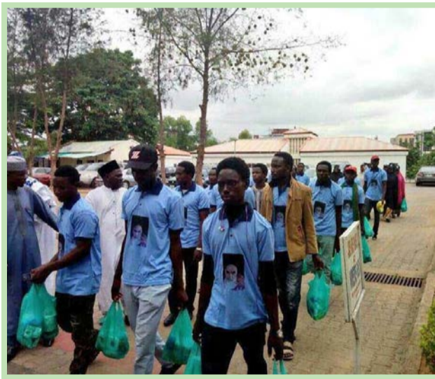
توزیع غذا میان فقرای نیجریه به نیابت از امام خمینی(ره)