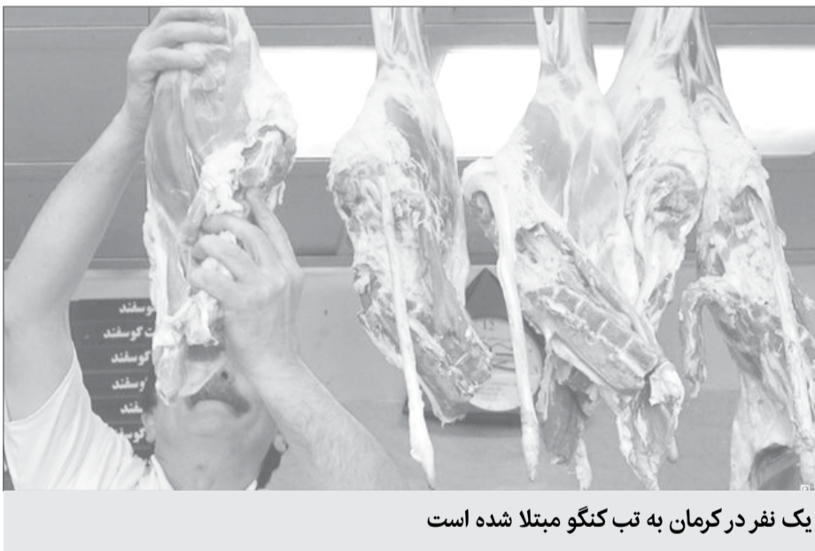
یک نفر در کرمان به تب کنگو مبتلا شده است