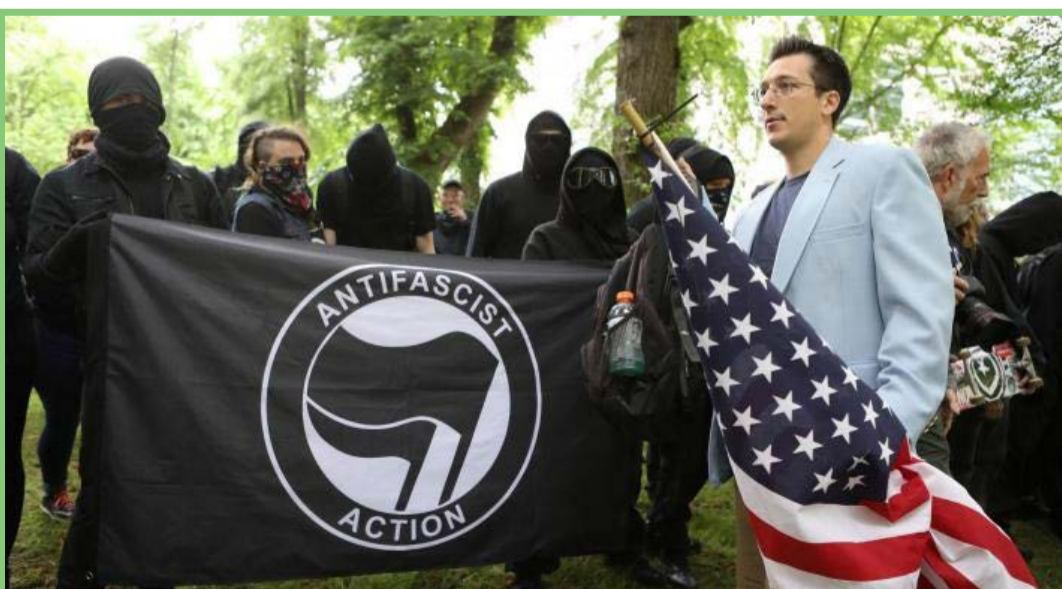
درگیری مخالفان و طرفداران ترامپ در پورتلند آمریکا