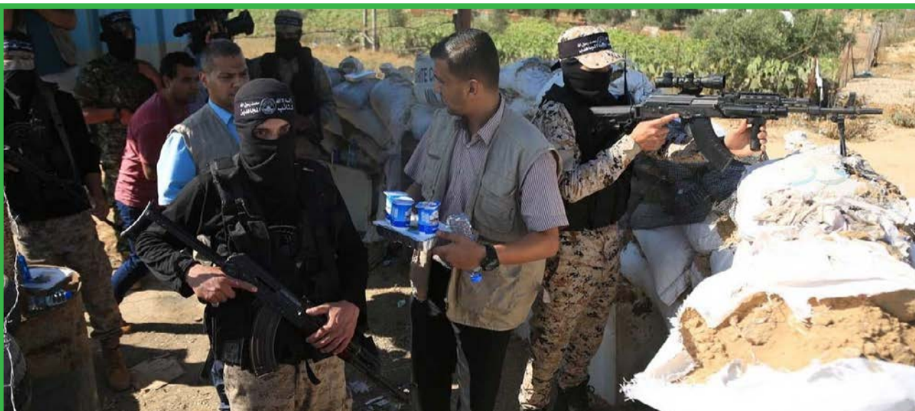
توزیع بسته های افطار برای رزمندگان غزه