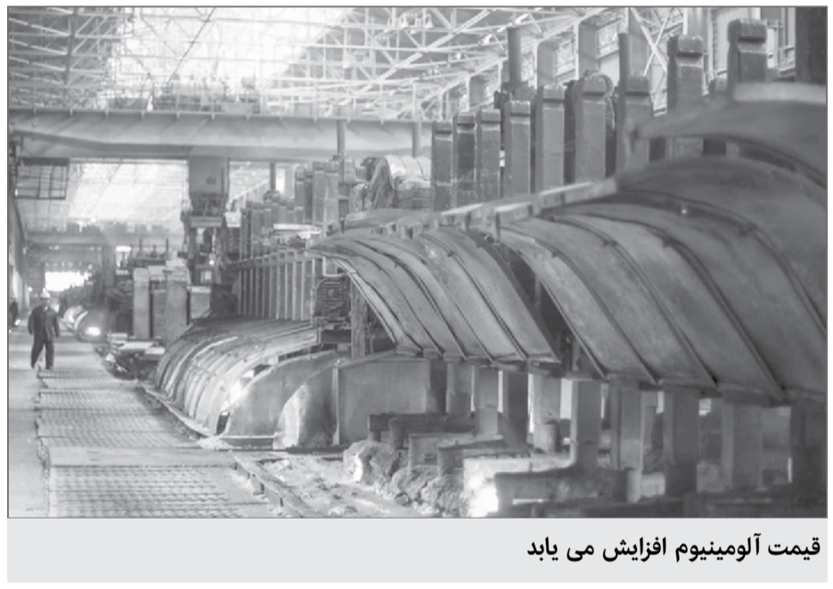
قیمت آلومینیوم افزایش می یابد

افزایش قیمت آلومینیوم بر سهام شرکت های بزرگ تولیدکننده این فلز نیز تاثیر گذاشته است. به عنوان نمونه سهام شرکت آمریکایی «آلکوا» که یک پنجم آلومینیوم جهان را تولید می کند، از ابتدای سال تا ۱۵ می بیش از ۱۵ درصد رشد داشته است. همچنین سهام شرکت نیروژی