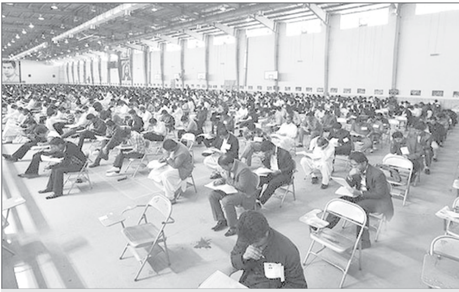
برای استخدام در طرح دستیاران جوان، آزمون برگزار می‌شود

محمدرضا رستمی، معاون امور جوانان وزارت ورزش و جوانان روز گذشته خبر داد که دولت با استخدام دو هزار جوان در این طرح موافقت کرده. هدف این طرح پرورش مدیران جوان برای جانشینی مدیران پا به سن گذاشته و جوان‌سازی دولت است و با اجرایی شدن آن، مدیران دولتی موظف هستند دو دستیار جوان داشته باشند. در حالی این طرح به فاز اجرا نزدیک شده که از سال