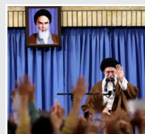
روز انتخابات، روز جشن ملی و شادی و شور است