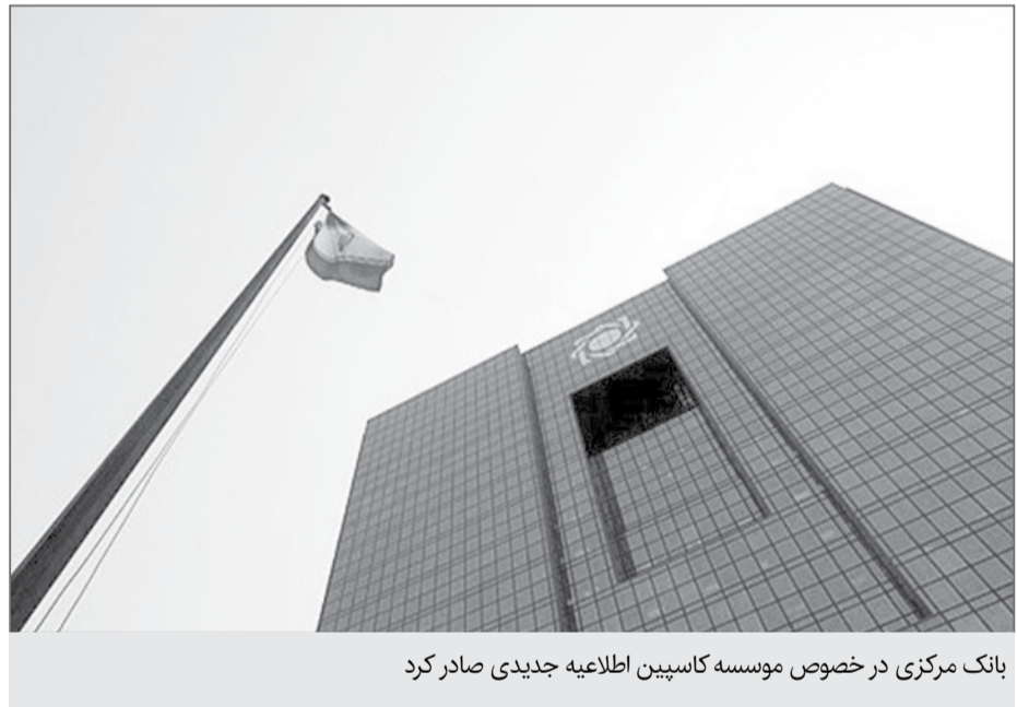
بانک مرکزی در خصوص موسسه کاسپین اطلاعیه جدیدی صادر کرد

بانک مرکزی در اطلاعیه ای که روز گذشته در این رابطه منتشر کرد اعلام کرد که با اولویت بندی انجام شده برای رسیدگی به امور کاسپین، در مرحله اول تا ۸۷ درصد از سپرده گذاران تعاونی منحل فرشتگان که بزرگترین آن ها نیز محسوب می شود مورد بررسی قرار خواهند گرفت. در توضیح بانک مرکزی آمده است که پیرو صدور مجوز فعالیت اسفند ۱۳۹۴ برای موسسه اعتباری