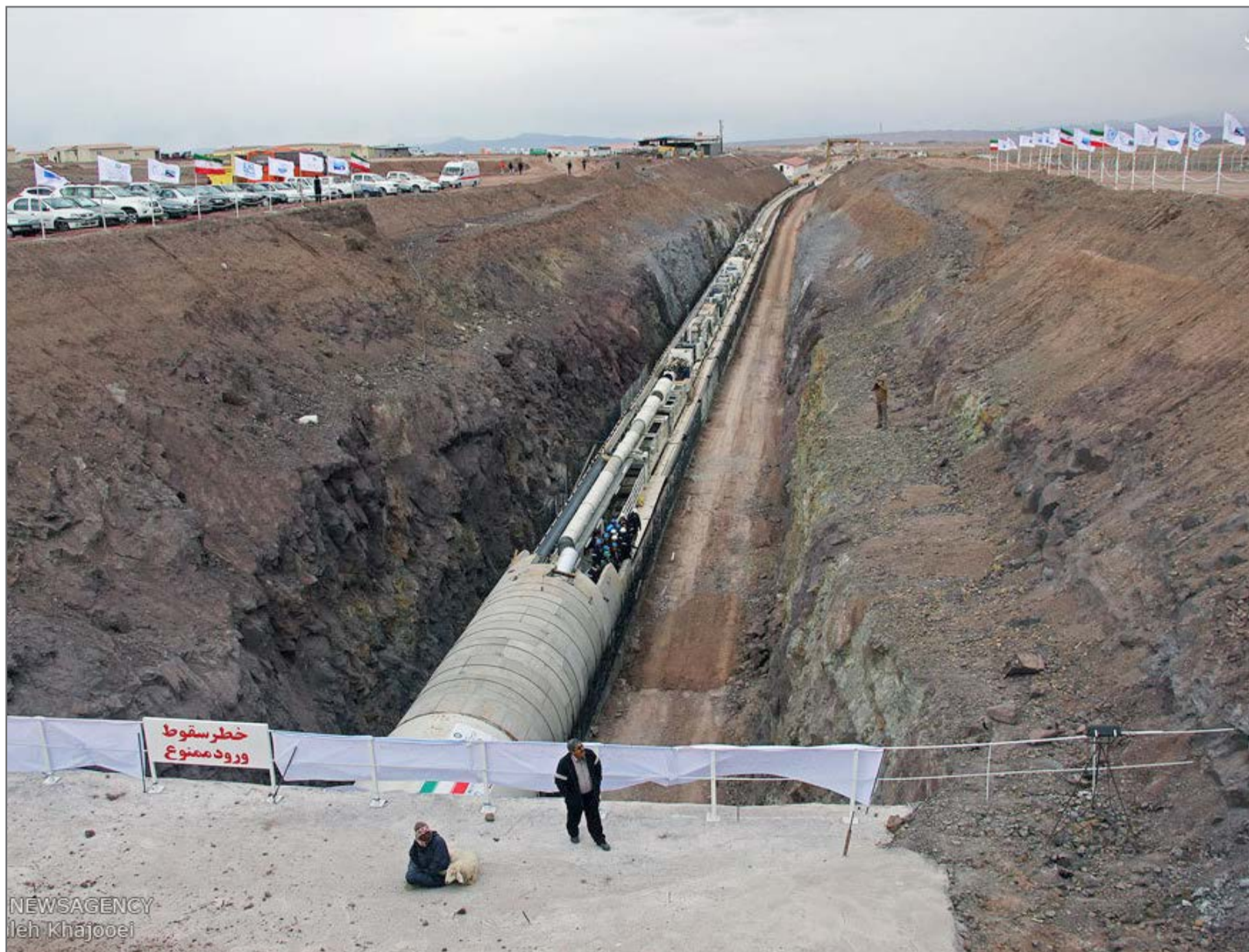
NEWSAGENCY Ileh Khajooei