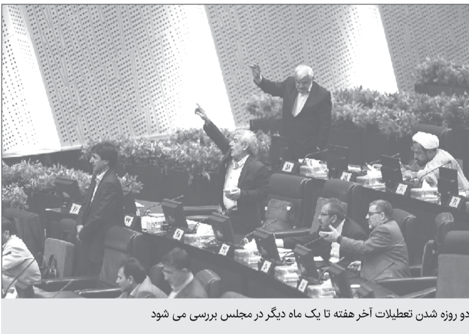
دو روزه شدن تعطیلات آخر هفته تا یک ماه دیگر در مجلس بررسی می‌شود

آن‌طور که سلمان خدادادی، رییس کمیسیون اجتماعی مجلس به خانه ملت گفته طرح ساماندهی تعطیلات رسمی جامعیت و پختگی لازم را نداشت به همین دلیل از مرکز پژوهش‌های مجلس درخواست شده کار تحقیقاتی و کارشناسی بر روی آن انجام دهد. به اعتقاد او موضوع ساماندهی تعطیلات در بین اقشار مختلف دچار چالش‌هایی است