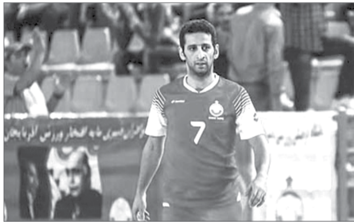
جواد اصغری، کاپیتان اسبق تیم ملی فوتسال

فوتسال یکی از بدترین سال‌هایش را پشت سر می‌گذارد. حرف هم می‌زنیم ناراحت می‌شوند اما واقعا وضعیت بحرانی است. ما کلی زحمت می‌کشیدیم و هر سال ۲۰ یا ۳۰ میلیون به قراردادهای اضافه می‌شد اما امسال یکباره قراردادهای نصف شد. فوتسالی‌ها چه گناهی کرده‌اند که به خاطر بی مسئولیتی چند نفر، چنین توانی باید بدهند؟ لیگ را ۶ ماه تعطیل می‌کنند