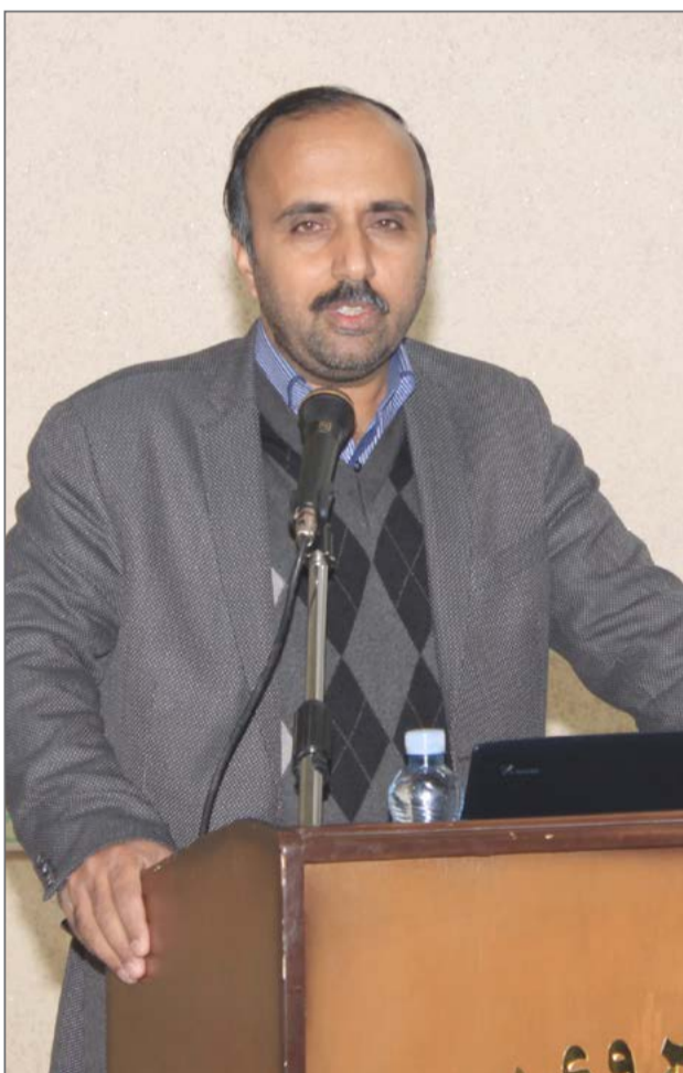
شهبها مدیرعامل برق شمال

هزینه ای که در سال ۹۵ برای تامین برق روستاها، توسعه شبکه و رفع ولتاژ آنها انجام شده بیش از ۹۰ میلیارد تومان بوده است. وی با اشاره به توانمندی کارکنان شرکت توزیع نیروی برق جنوب و ایده های خلاقانه آنها، خاطرنشان کرد: توسط نیروهای شرکت، یک جعبه