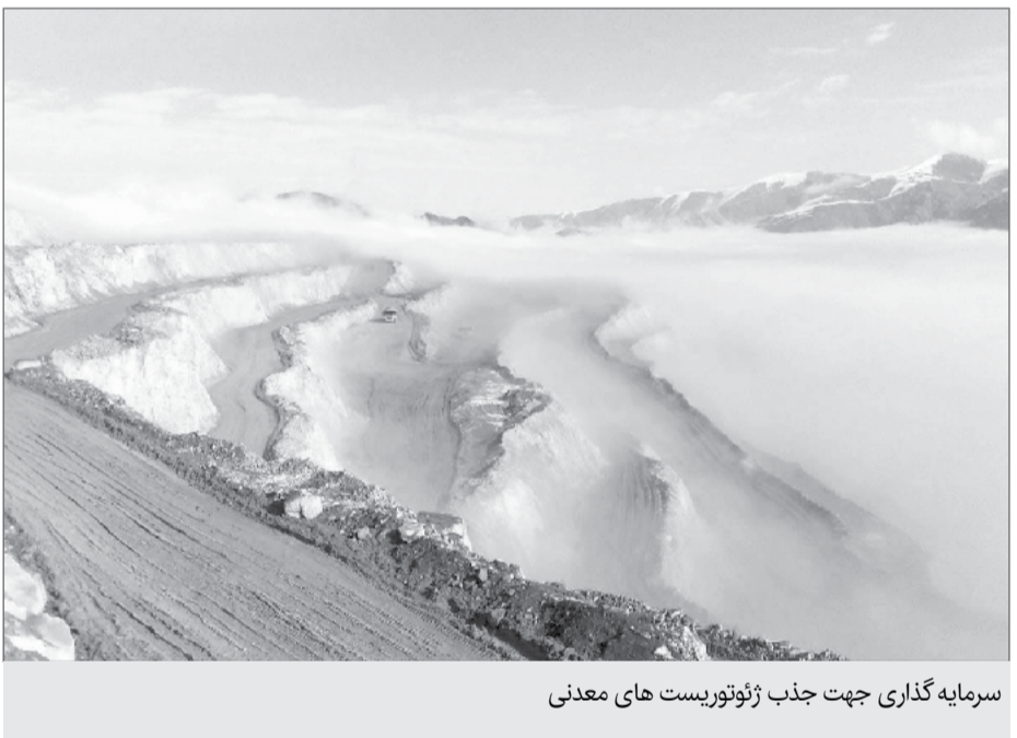
سرمایه گذاری جهت جذب ژئوتوریست های معدنی

همین معادن بودند که اقتصاد کشور را سر پا نگه داشتند. باید اشتغال بخش معدن اعلام شود تا ببینیم این بخش چه تعداد اشتغال در کشور ایجاد کرده برای مثال یک ماده معدنی همچون آهن تمام صنعت سرامیک، سیمان و تصفیه را به خود وابسته کرده است و اگر آهن نباشد این صنایع هم نخواهند بود. رئیس سازمان نظام مهندسی معدن با تاکید بر لزوم توجه بیشتر به معدنکاران افزود: معدن کاران با شرایط بسیار سختی کار می کنند و سرمایه گذاران بخش معدن برای به نتیجه رسیدن، مشکلات زیادی را پشت سر می گذارند و نباید به گونه ای باشد که از آنها به