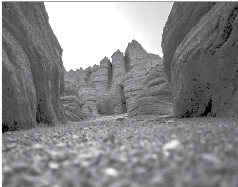
عکس تپاسر خدیشی

دره راگه که به دلیل پدیده فرسایش آبی در دشت رفسنجان شکل گرفته است با عمقی معادل ۷۰ متر و سن تخمینی ۲۰ هزار ساله و وجود چشمه ساران متعدد در عمق زمین از جمله بکرترین و زیباترین مناطق کویری کشور محسوب می‌شود. این دره به دلیل گستره پهناور و تنوع یکی از بی نظیرترین شرایط اقلیمی را برای اکوتوریسم در کشور به خود اختصاص داده است و جالب اینکه هر از چندگاهی مکانی جدید و بی نظیر از حیث گردشگری در این منطقه شناسایی و معرفی و به یکی از قطب‌های اصلی گردشگری تبدیل می‌شود. دره راگه در نزدیکی شهر رفسنجان از جمله این مکان‌ها است، در کویر اطراف شهر معروف رفسنجان دره ای به طول ۲۰ کیلومتر و عمق ۷۰ متر وجود دارد که با عرضی ۱۸۰ متری منظره ای فوق العاده زیبا را به وجود