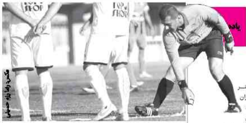
تمامی بازی‌های باقی تیم مس کرمان که تمامی باشگاه‌های لیگ یک است که به واسطه‌ی اتر گذاری نتایج بازی‌ها در تمامی اشتباهات داوری در

کارشناسان داوری، قضاوت‌های لیگ یک در رقابت‌های فصل قبل به شدت ضعیف بود و موجب تغییر نتایج در برخی از بازی‌ها شد، این موضوع در این فصل از رقابت‌های لیگ یک نیز نه تنها بهتر نشد که تداوم اشتباهات داوری به شکل مشهودی همچنان ادامه دارد.