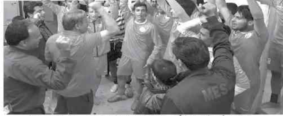
در هفته‌ی آخر رقابت‌های لیگ برتر فوتبال جوانان کشور، تیم مس کرمان میزبان برق جدید شیراز بود و کار بسیار دشواری برای حفظ بقای خود در این رقابت‌ها داشت.