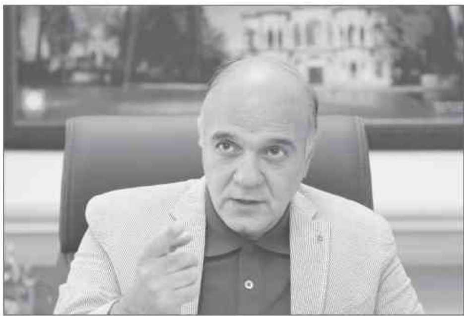
وفایی، مدیرکل میراث فرهنگی استان

پس از سیل اخیر و سرریز شدن سد لساء رودخانه‌های این منطقه از استان پس از تیم قرن خشکسالی