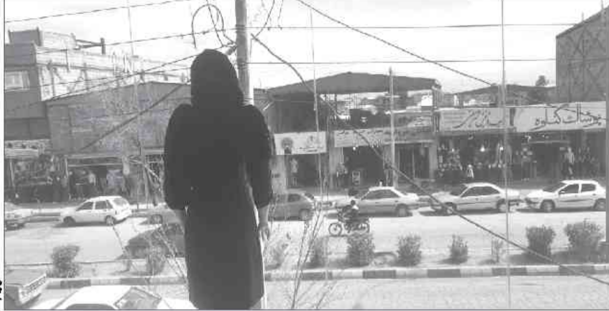
بازار پر رونق بلوار باقدرت

تعداد زیادی از مردم کرمان اسم بلوار «باقدرت»