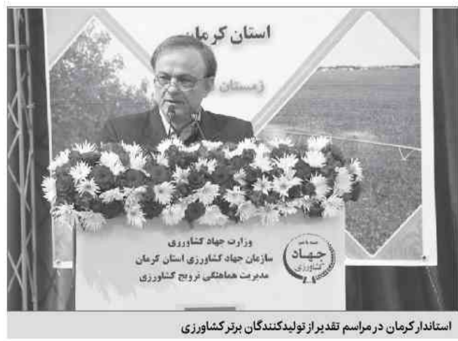
استاندار کرمان در مراسم تقدیر از تولیدکنندگان برتر کشاورزی

حضور استاندار، فرماندار رفسنجان، رئیس سازمان کشاورزی، رئیس اتاق بازرگانی کرمان و سایر مسئولین استانی در اتاق کرمان برگزار شد. استاندار گفت که باید بروکرسی دولتی را از بین ببریم و امروز ما در کرمان هر منطقه را به یک موسسه اقتصادی واگذار کرده ایم. اگر موفق شویم دولت را با تفکر خصوصی اداره کنیم، اتفاقات خوبی رقم خواهد خورد. علیرضا رزم حسینی گفته طرح تجمیع مدیریت فنی در واحدهای کشاورزی باعث می‌شود یک نظام یکپارچه کشاورزی با بهره‌وری بالا و حضور رزم حسینی وضعیت کشاورزی استان دولتی را نگران کنند خواند و گفت: «با توجه به تغییر اقلیمی که اتفاق افتاده و صدمه ای که ما به آب و خاک زده ایم بهره‌وری ما صفر است اما چون به صورت مستقیم یا غیر مستقیم پاراله دریافت می‌کنیم تصور می‌کنیم سود داشته‌ایم.» وی مشکلات عمده کشاورزی استان را کیفیت محصولات، قیمت بالا، عدم دسترسی کشاورزان به بازار فروش،